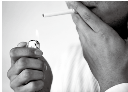
この 1 本に 200 種類以上の有害物質が・・・

余談ですが、1 箱 300 円のたばこを 1 日 1 箱、1 年間吸い続けたとすると・・・ (300 \text{ 円} \times 1 \text{ 箱}) \times 365 \text{ 日} = 109,500 \text{ 円} 。これだけあれば、のんびり国内旅行も夢じゃない？