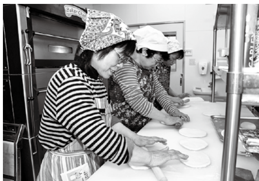
米粉が入った生地を丁寧にのばします

町民の食生活改善を推進し、健康の保持・増進を図る猪苗代町食生活改善推進員の会員ら10人は4月19日、就労継続支援施設「さぎそうの家」を訪れました。