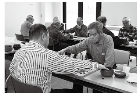
皆さん無言で真剣勝負です

見学者・会員も募集中。9:00 から 17:00 までの都合のいい時間を見つけて参加することも可能だそうです。