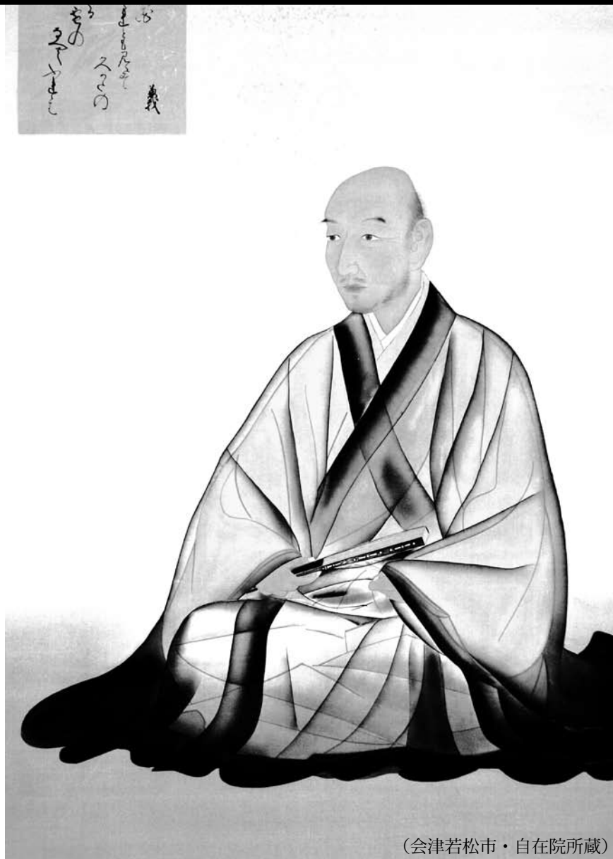
（会津若松市・自在院所蔵）

猪苗代兼載は今から五五七年前の享徳元年（一四五二）に、町内の小平潟で生まれました。六歳の時に故郷を離れ、連歌師として修業を積み、連歌師の最高の位である京都の北野連歌会所奉行の職に就いた当代きつての文化人です。今年（2009）は兼載の没後五百年という節目の年。今月号では郷土の偉人の生涯をたどります。