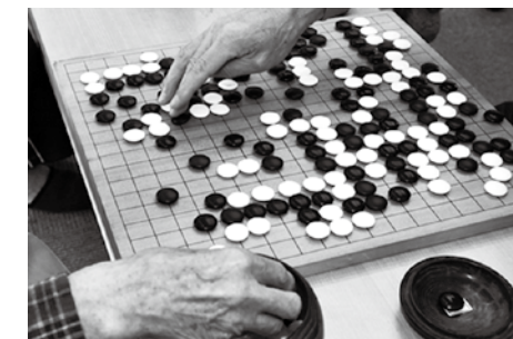
パシッと小気味良い音が響きます