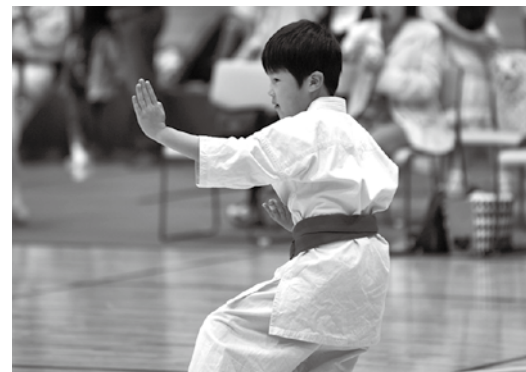
練習を積み重ねた見事な型を披露する児童

極真空手道選手権福島県大会（型の部）は4月19日、カメリーナで開催され、少年から一般まで約110人が参加、日ごろ道場で練習した型を披露しました。