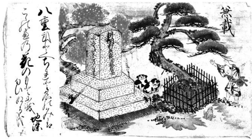
右 兼載像（会津若松市自在院所蔵） 左 江戸時代後期に小平潟近景を描いた十五図の内の一つ、猪苗代兼載の墓を描いたもの 「八重一重 散れと名のみは九重の 花のもとにも匂いぬるかな 地染」の和歌が添えられている 下左 幹の梅 小平潟天満宮が移される前の場所にある古木。 下中 小平潟にある兼載の母「加和里」の墓 下右 小平潟天満宮前にある兼載の歌碑 「さみだれに 松遠さかる すさきかな」