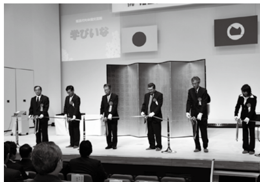
テープカットで開館を祝いました

町民の文化活動や生涯学習の新たな拠点となる猪苗代町体験交流館の開館式は3月29日、同館の大研修室で開催されました。