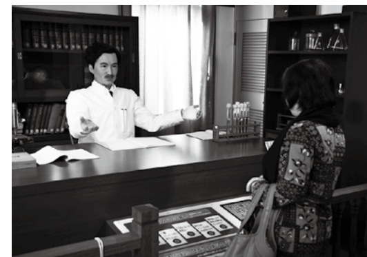
博士が身ぶり手ぶりを交えて話します

町内の野口英世記念館では3月19日、開館70周年を記念した新展示室「野口博士の研究室」がオープンしました。