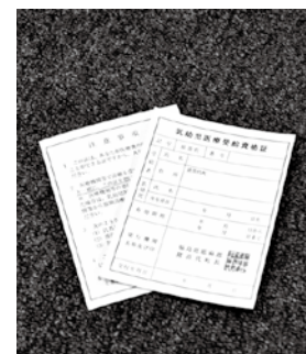
写真は現在の資格証 4月から新しい資格証になります

校4年生まで(6年4月2日から11年4月1日生まれの人)の児童のいる人が対象になります。対象となる児童のいる人については、各世帯主あてに1月末に申請の手続きについて郵送していますので、詳しくはそちらを確認してください。 ▼どこで、いつまで手続きすればいいの？ 申請の受付は、役場町民生活課国保年金業務です。 【提出期限】 ・21年3月6日(金)まで ※乳幼児及び児童医療受給資格証については、3月末に各保護者へ郵送します。 ※期限までに申請がない場合、医療費助成の対象になる月日が遅れることになりますので必ず手続きをしてください。 ※対象年齢にあっても、受給資格証がないと助成は受けられません。 ▼問い合わせ先 町民生活課 国保年金業務 ☎(62) 2114