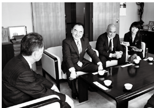
右から山城さん、大城課長、松本参事監

本県と沖縄県との交流を目的とした「うつくしま・ちゅらしま総合交流事業の一環として、本町の児童らが沖縄を訪れる「雪だるま親善大使事業」（関連 10、11 ページ）。そのお礼を兼ねて沖縄県の松本参事監ら訪問団 4 人は 1 月 23 日、津金町長、土屋教育長を表敬訪問しました。