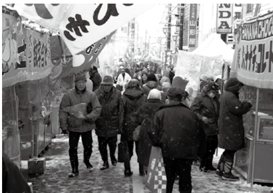
先着 200 人の福袋は今年も人気でした

新春恒例の初市「十三日市」は 1 月 13 日、本町・新町通り（中央通り商店街）で開催されました。