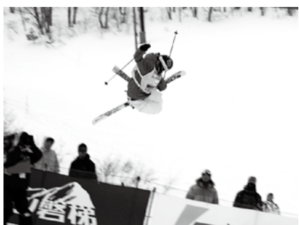
事実上の初代王者決定戦ハーフパイプ

全種目が集結するため、その規模はとても大きく、五輪の前年に開催されることから、五輪の前哨戦、プレ大会としても世界中の関係者から注目されています。