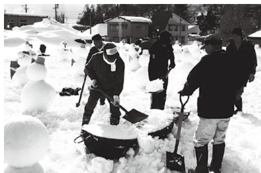
写真は昨年のサポーターズクラブ