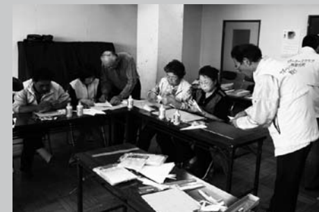
選手へのプレゼントになる折り鶴ならぬ折り白鳥を折る会員の皆さん

そのためには町民一人一人が暖かいおもてなしの心で迎えるとともに、できるだけ多くの方が会場へ足を運んで応援することが重要だと思います。二度と来ることがないであろうこの猪苗代開催、わたしたちSCは悔いのないよう精一杯頑張りますので町民の皆さんのご支援とご協力をよろしくお願いいたします。