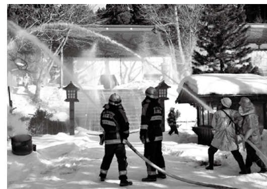
正確な放水を見せる団員ら

町内の貴重な文化財を守り、後世に伝えるための文化財防火デー火災防御訓練は1月26日、土津神社で実施されました。