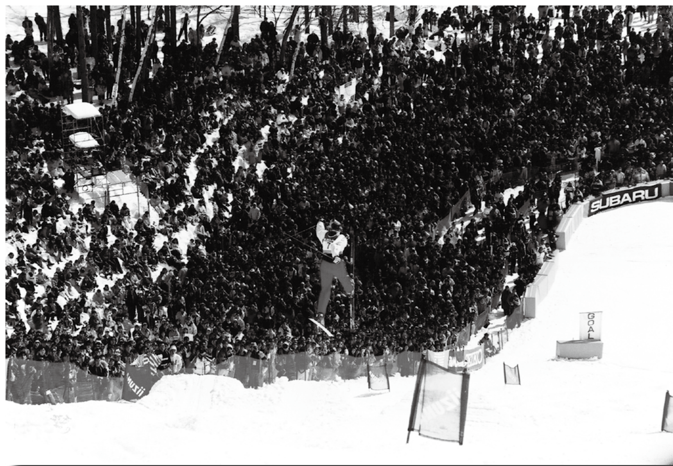
1997年 長野県飯綱高原での世界選手権大会の様子

開催地であるというブランドは消えることはないでしょう。大会を観戦した子どもたちが興味を持ち、次世代のスキー選手に育つことも考えられます。世界中から集まる選手や関係者、観客や報道陣などは、地元へ経済効果をもたらします。だからこそ本町はこの大会の誘致に全力で乗り出しました。