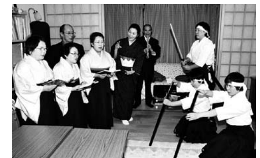
詩舞、剣舞もお稽古しています

会津には「白虎隊」という誰でも聞いたことがある吟もあります。一緒に吟じてみませんか。