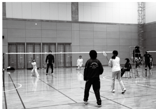
親子での出場が多かったようです

猪苗代バドミントンクラブ(眞田隆会長)が主催する第 1 回町民バドミントン大会は 12 月 14 日、カメリーナで開催され、各クラス合わせて約 60 人が参加。ダブルスで勝敗を競い合いました。親睦を目的とした同大会らしく、会場では「お父さん久しぶりのバドミントン、どう?」「いや～疲れた～」といった会話も聞かれ、参加者たちは終始和やかなムードの中で爽やかな汗を流しました。各クラスの優勝ペアは次のとおりです。