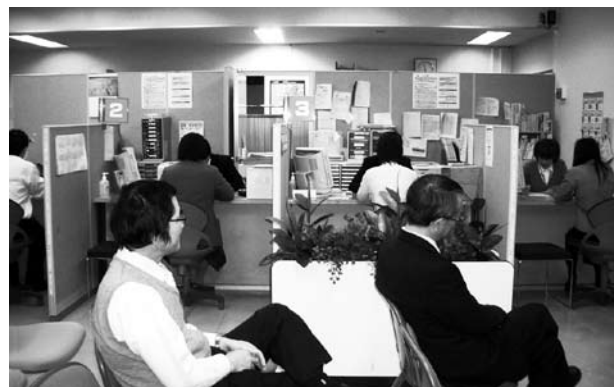
会津若松年金事務所の相談コーナーの様子

日本年金機構 ■問い合わせ先 日本年金機構経営企画部広報グループ ☎ 03-5344-1100 ホームページ http://www.nenkin.go.jp/