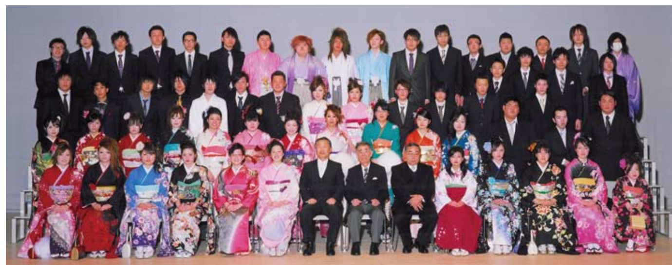
月輪・長瀬・吾妻地区の新成人