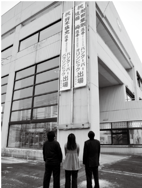
3人の活躍を願って役場に掲げられた懸垂幕。町を挙げて応援します。選手の皆さん頑張ってください。