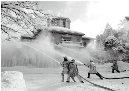
水幕ホースと放水による消火訓練の様子

町内の貴重な文化財を守り、後世に伝えるための文化財防火デー火災防御訓練は1月26日、天鏡閣で実施されました。