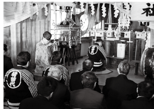
町民の皆さんが安全に暮らせるよう祈願しました

今年1年の無火災、無災害などを祈願する出初め式は1月6日、町内の諏訪神社で執り行われました。