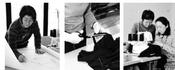
(写真左)型紙を写しておけば、自宅でも楽しめます (写真中)思いどおりの形に生地をカットしていく。緊張する瞬間です (写真右)先生がお手本を見せてくれるので安心です