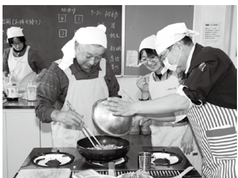
参加した皆さんは、毎回料理を楽しんでいます

*定員になり次第締め切りますので、参加を希望する人は、早めに電話で申し込んでください。