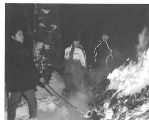
その日についたもちを焼く達沢地区の歳の神。