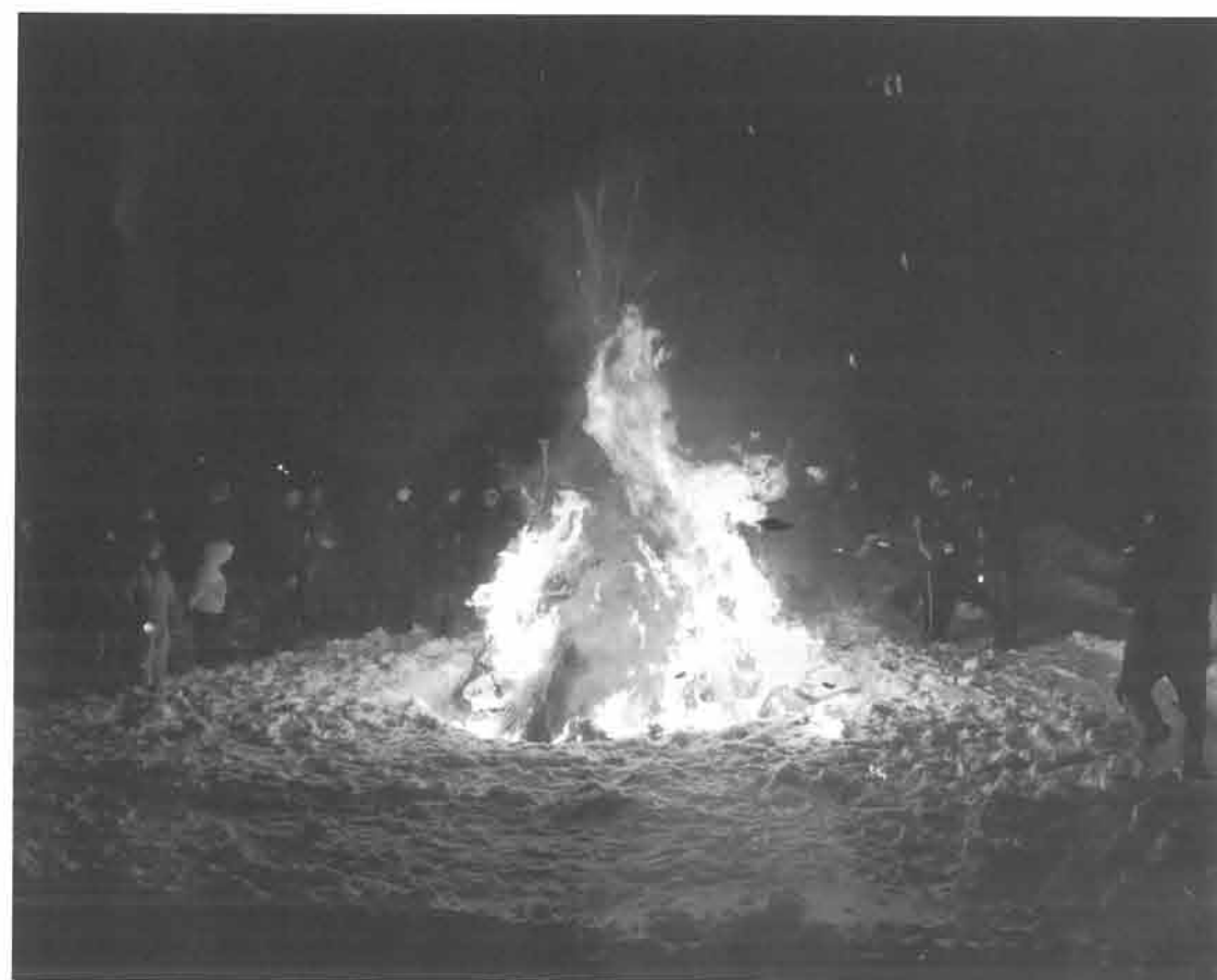
1月15日に実施された百目貫地区の歳の神。子どもたちは猛々しい炎の迫力に目を奪われていました。

失われそうな伝統がある反面 根強く残るものもある 町内の半分以上の地区に残る 歳の神という伝統 そこに込められた意義とは