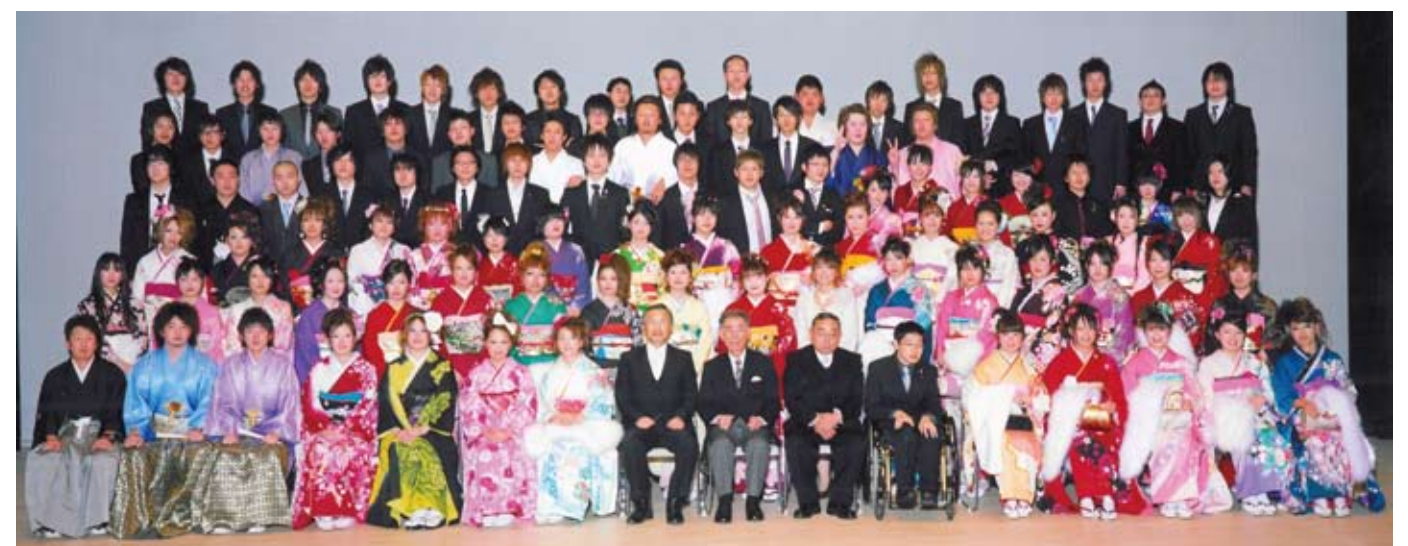
猪苗代・翁島・千里地区の新成人