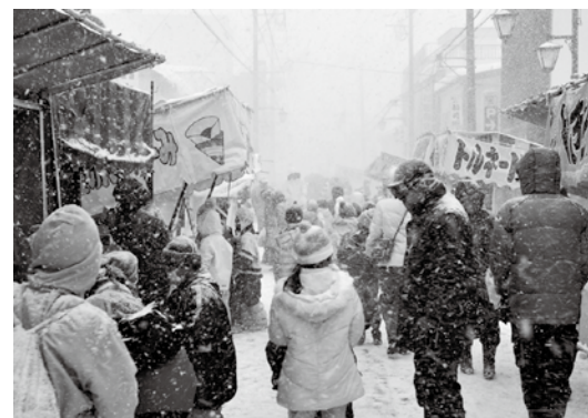
雪の中多くの買い物客でにぎわった商店街

新春恒例の初市「十三日市」は1月13日、本町・新町通り(中央通り商店街)で開催されました。