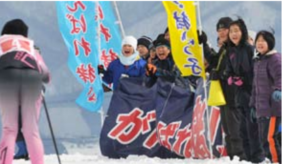
距離競技会場で選手たちに大きな声援を送る児童や保護者ら