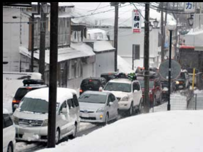
主要地方道猪苗代塩川線の新町交差点付近。立ち往生する車などにより国道 115 線がまひ状態となった影響で、国道 115 号線につながる道路でも渋滞が続いた