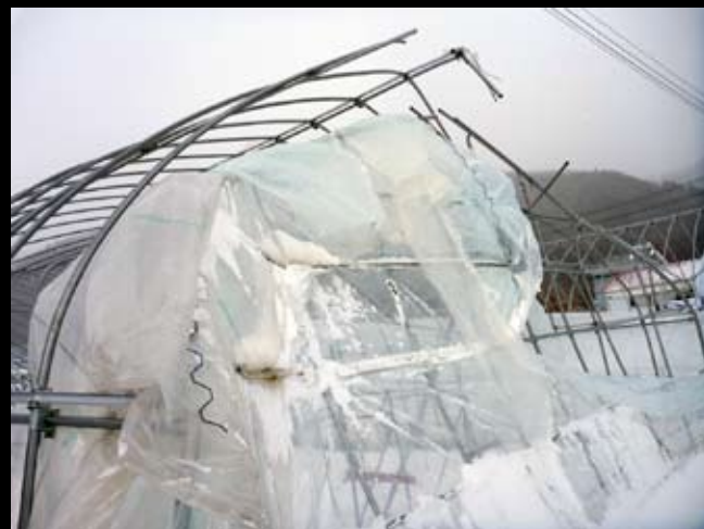
ビニールが剥がれ、骨組みが変形した農業用パイプハウス。ビニールが掛かったハウスは風の影響を受けやすく、特に被害が大きかった