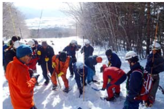
雪に埋まった人の救助訓練に取り組む参加者

町山岳会、警察署や消防署などで組織する猪苗代地区山岳遭難対策協議会は 1 月 29 日、猪苗代スキー場で冬山遭難救助訓練を実施し、万一の事故に備えました。訓練には、同協議会の会員約 30 人が参加。雪崩に巻き込まれた人の捜索、救助訓練やスノーシューを履いての歩行訓練などに取り組みました。参加者らは、救助技術や知識の向上のため、真剣な表情で訓練に取り組み、冬山の遭難事故防止に向けて決意を新たにしました。