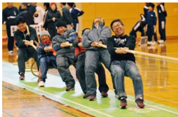
楽しみながらも全力を尽くす選手たち