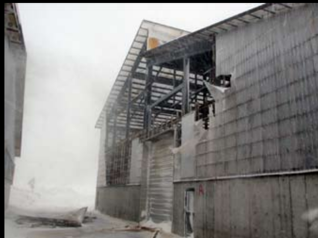
外壁が損壊した優良堆肥製造施設。施設の中には大量の雪が吹き込んだ