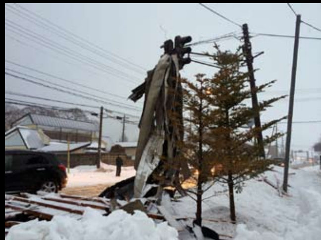
飛ばされて信号機に掛かった屋根のトタンが、風のすさまじさを物語る