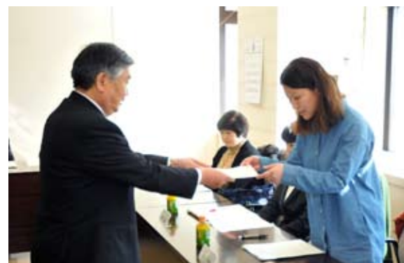
前後町長(左)から委嘱状を受ける委員

国が 27 年度に導入予定の「子ども・子育て支援新制度」を見据え、町の事業計画策定に関し、意見を具申するための「町子ども・子育て会議」の第 1 回目の会議が 2 月 24 日、町役場で開かれ、委員に委嘱状が交付されました。今後は、26 年度中の事業計画策定を目指し、幼児期の教育・保育や、子育て支援事業などについて審議します。委員は子育て中の保護者や教育、保育、子育て支援等に関わる町民の代表など、17 人で構成しています。