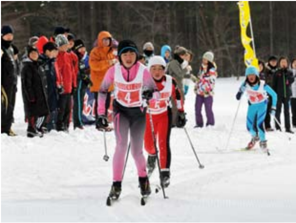
女子距離リレーで熱戦を繰り広げる選手たち