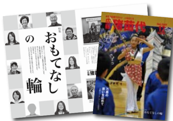
広報紙の部で佳作を受賞した 12 月号

第 60 回福島県市町村広報コンクール(県・県広報協会主催)において、広報猪苗代が広報紙・町村の部で佳作を受賞しました。表彰式は 2 月 20 日、県庁で行われました。佳作となったのは、特集「おもてなしの輪」を掲載した 12 月号です。受賞できたのはいつも快く取材に応じてくださる町民の皆さんのおかげです。本当にありがとうございます。今後も皆さんを応援するまちの応援マガジンとして頑張っていきますので、よろしくお願いします。