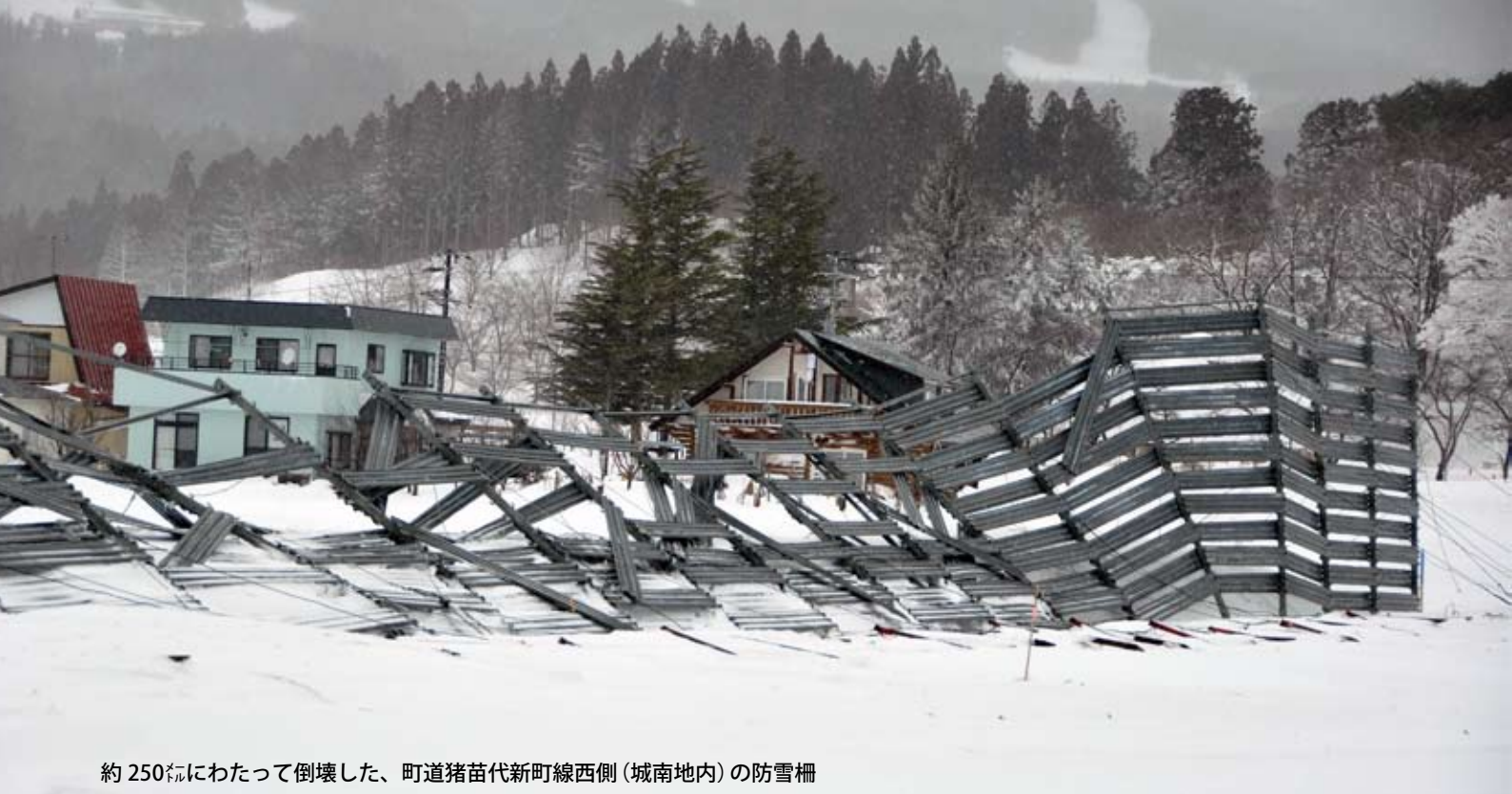
約 250mにわたって倒壊した、町道猪苗代新町線西側（城南地内）の防雪柵