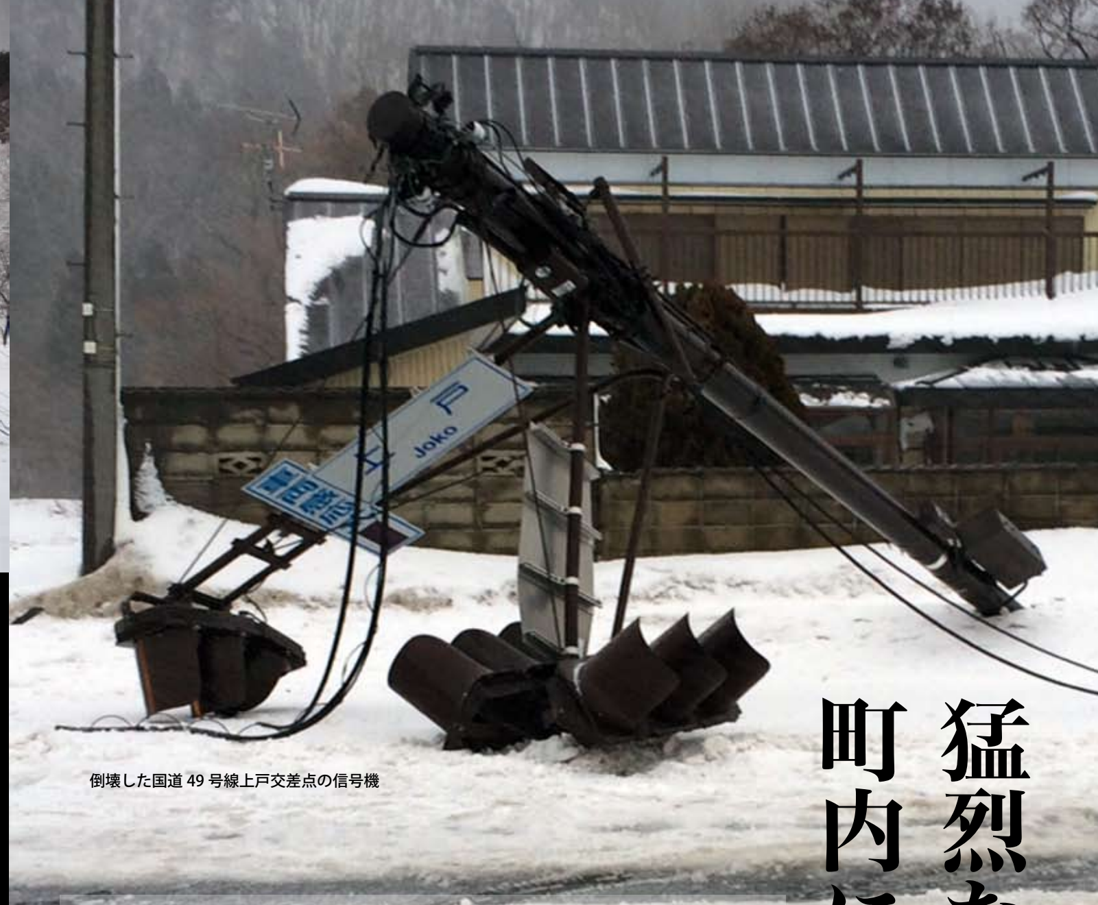
倒壊した国道 49 号線上戸交差点の信号機