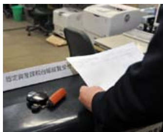
印鑑は忘れずにお持ちください。代理の人は委任状と身分証明書などが必要です