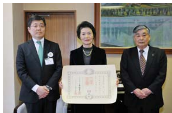
伝達式に出席した由紀子さん(中央)