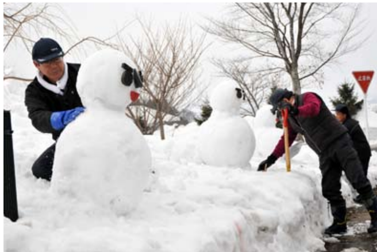
ライオンズクラブやロータリークラブ、長瀬区長会など、5日間で延べ88人が、会場へ向かう道路沿いなどに歓迎の雪だるまを約200体作成した