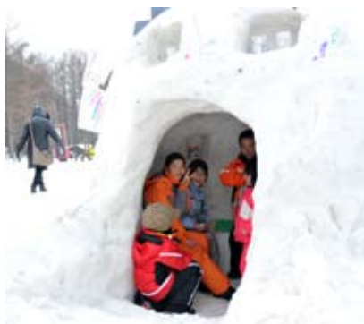
ゲレンデ内のおもてなし広場に作ったかまくらが子どもたちに好評。おもてなし広場ではアイスや甘酒も振る舞われた