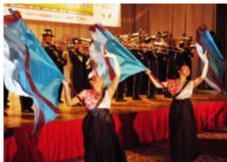
開会式でマーチングバンドの演奏を披露した長瀬小の児童。演奏が終わると、選手たちから大きな拍手が送られた

また、大勢の町民が会場へと足を運び、選手たちに大きな声援を送りました。観戦チケットを配布された町内の小・中学生たちも訪れ、世界トップレベルの競技に触れました。