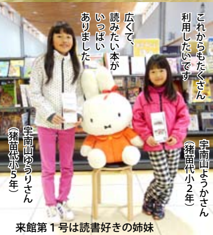
来館第1号は読書好きの姉妹