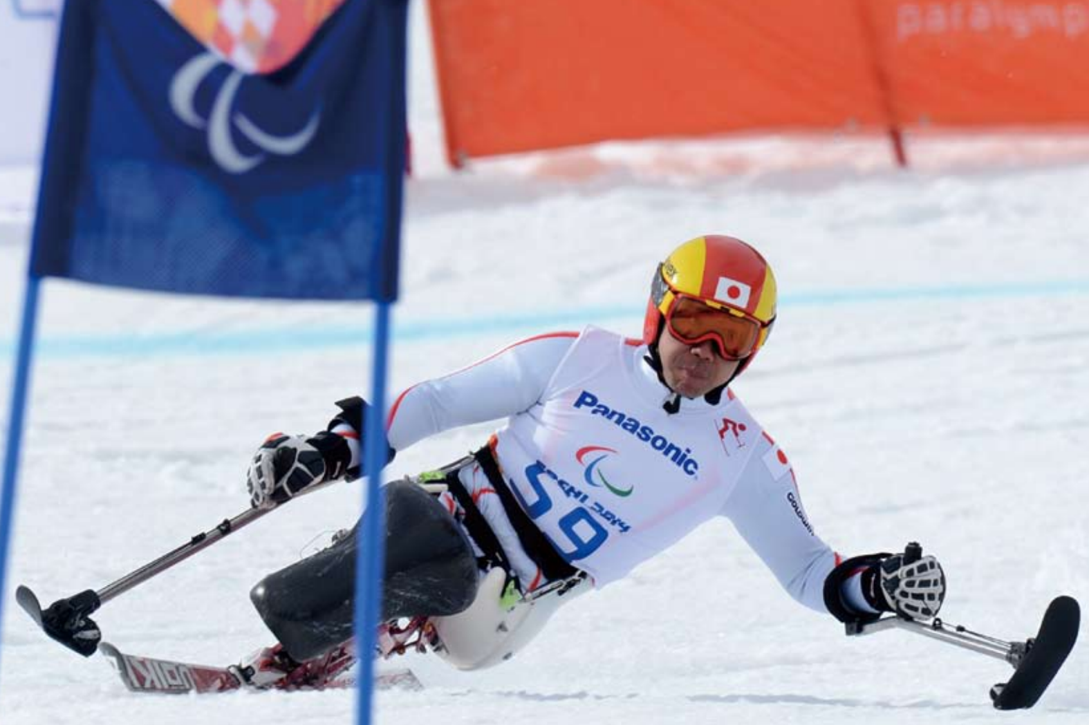
銅メダルを獲得した滑降競技での滑り