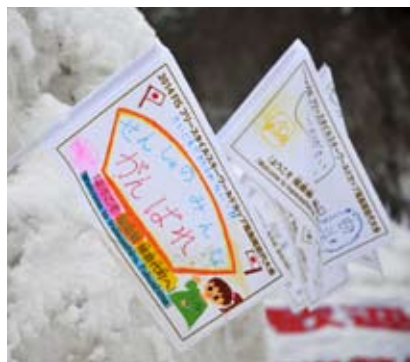
町内6小学校の児童たちが応援の旗を作成。会場に続く道路やおもてなし広場に設置された雪だるまなどに付けられた