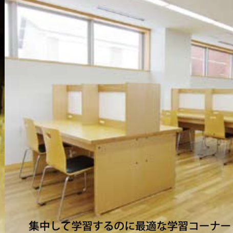
集中して学習するのに最適な学習コーナー