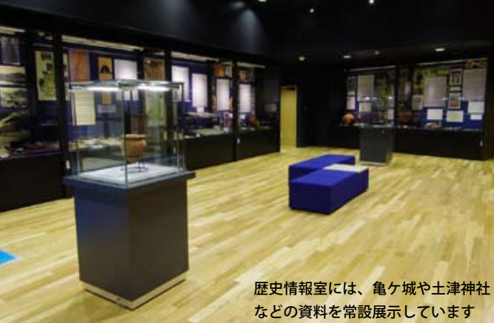
歴史情報室には、亀ヶ城や土津神社などの資料を常設展示しています