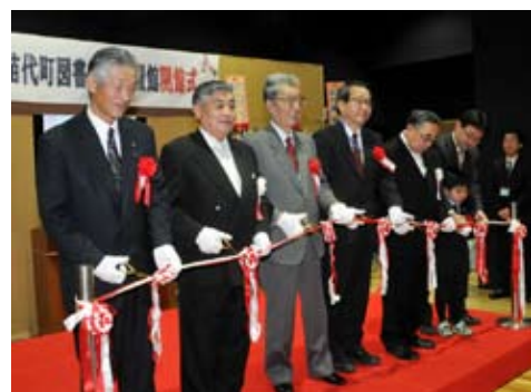
開館式の最後には関係者によるテープカットが行われ、盛大に開館を祝いました