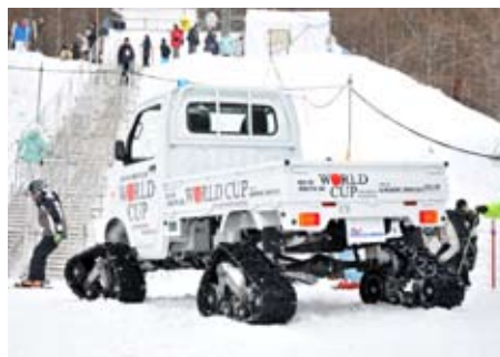
会津自動車工業から無償で貸し付けを受けた、雪上走行可能な特殊軽トラックが荷物の運搬などに大活躍