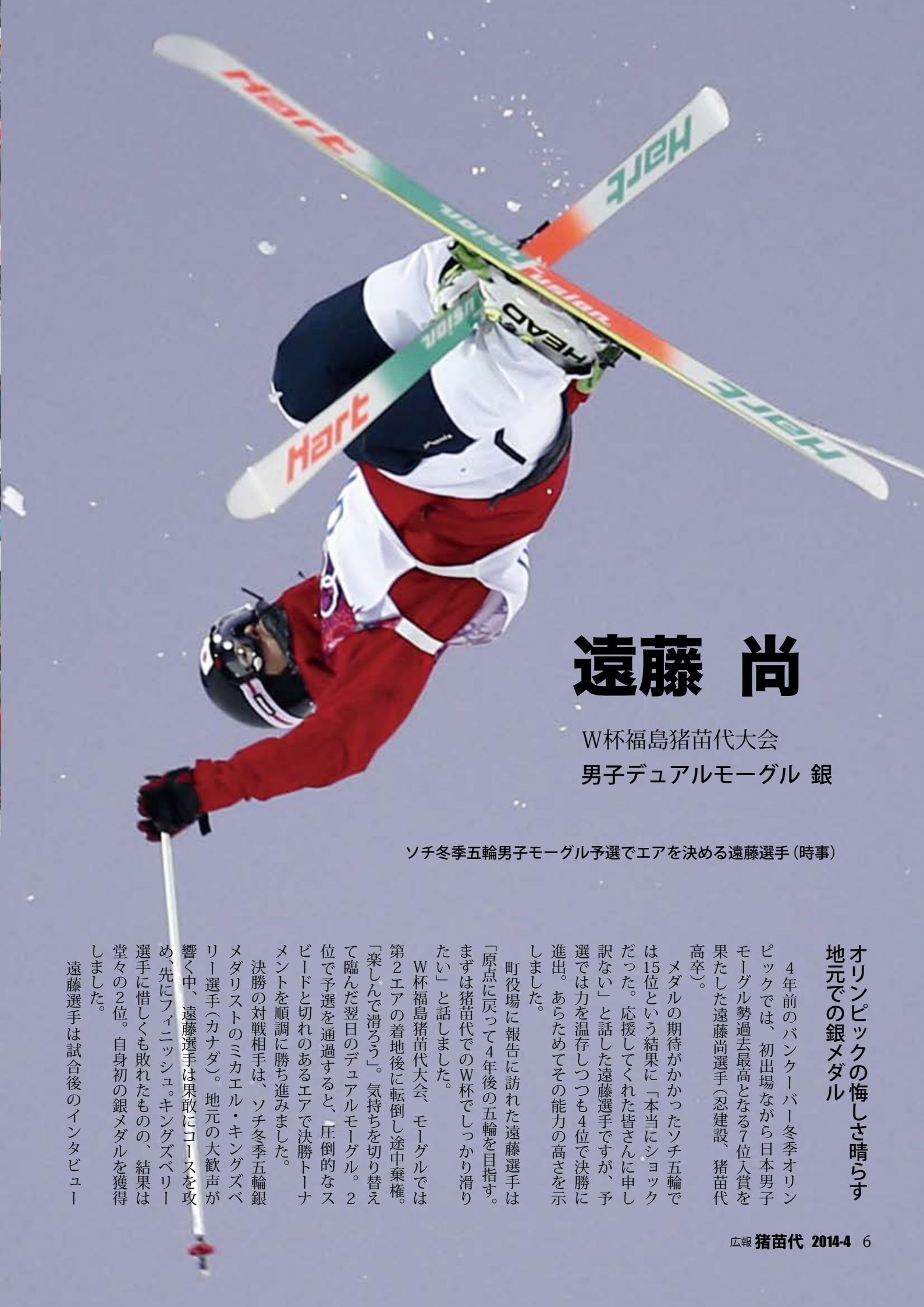
1_ 圧倒的なスピードでコースを駆け抜ける遠藤選手 2_ 遠藤選手を祝福する観客 3_ デュアルモーグルで2位となり、3位の星野選手とグータッチを交わす 4_ 遠藤選手のエア