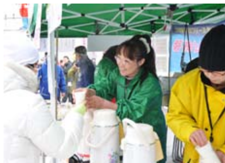
スキーリゾートふくしま創造会議などが選手らに温かい飲み物や磐梯山エリアのお菓子などを振る舞った