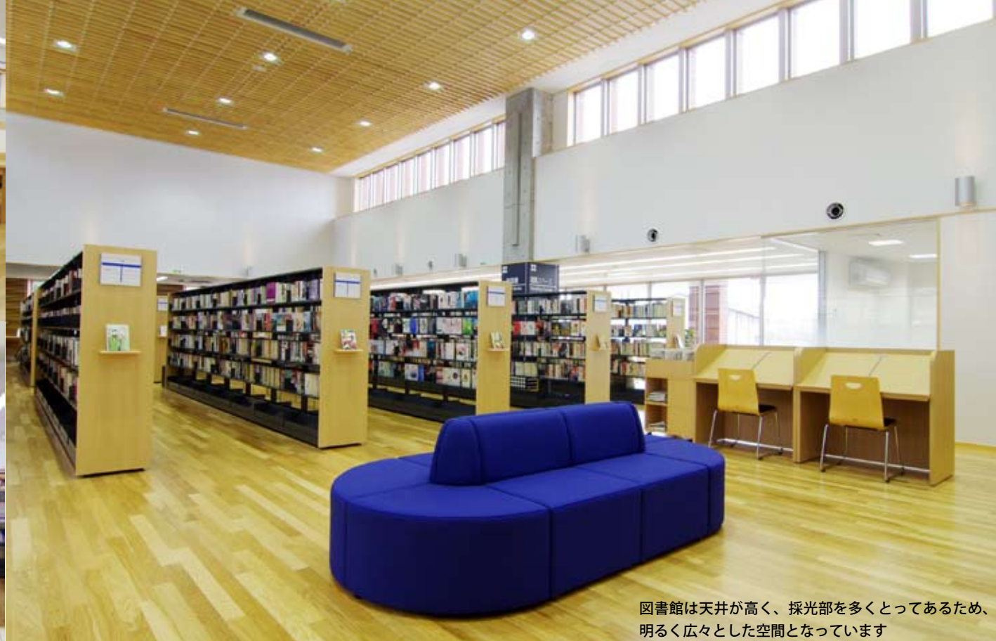
図書館は天井が高く、採光部を多くとってあるため、明るく広々とした空間となっています