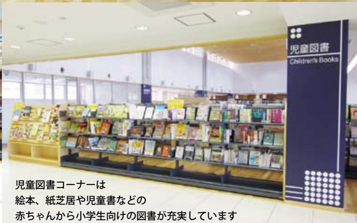
児童図書コーナーは絵本、紙芝居や児童書などの赤ちゃんから小学生向けの図書が充実しています