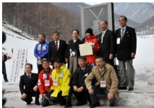
2009年のフリースタイルスキー世界選手権猪苗代大会で2冠に輝いた、上村愛子選手の功績をたたえる記念碑。開会式に先立ち除幕式が行われた

前走を務めた2人にインタビュー 【遠藤、星野両選手に続け ～モーグルの聖地で育つ選手たち～】