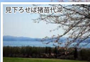
見下ろせば猪苗代湖