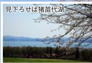
見下ろせば猪苗代湖