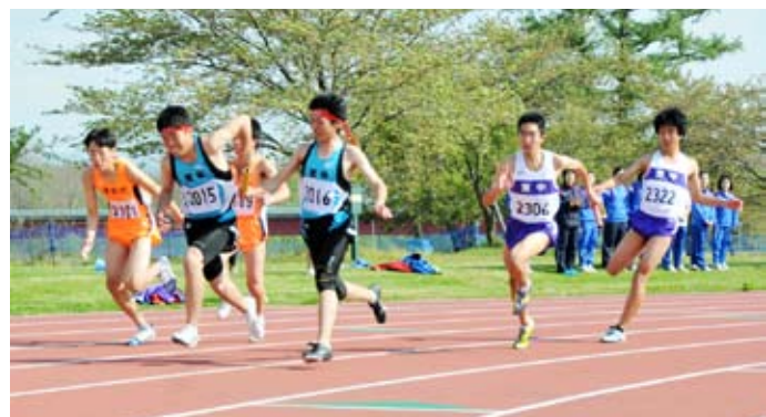
共通男子400㍍リレーで懸命に走る選手たち