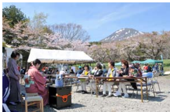
絶好のロケーションの下、花見を楽しむ来場者