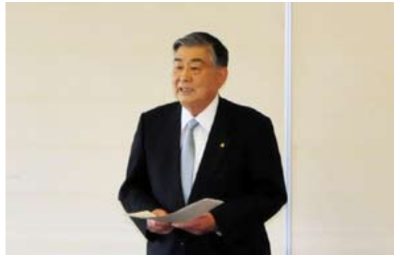
発足式であいさつを述べる前後町長

町が整備をしている「(仮称)道の駅猪苗代」を運営する第三セクター「株式会社道の駅猪苗代」が5月27日に発足し、平成28年の開業に向けての準備が本格的にスタートしました。資本金は5600万円で、そのうち5000万円を町が出資し、前後町長が社長を務めます。発足式は同日、町役場で行われ、前後町長が「できるだけ早く道の駅を開業し、町の活性化につなげたい」とあいさつしました。