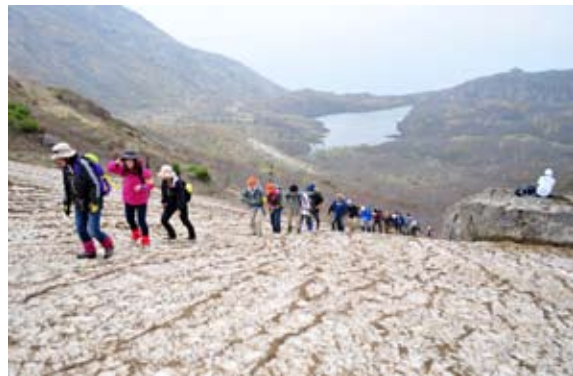
残雪を踏みしめて山頂を目指す登山者

福島県を代表する名峰磐梯山(1816㍎)の山開きは5月25日に行われ、約3500人の登山者が山頂を目指しました。猪苗代登山口では、関係者や登山者らが参加して安全祈願祭が行われ、シーズン中の無事故を祈願しました。午前中の山頂付近は霧に覆われ、大パノラマを望むことはできませんでしたが、登頂した人たちは山頂に祭られた磐梯明神に参拝したり、記念撮影をしたりして思い出を作っていました。