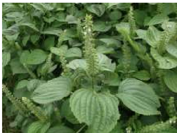
① 開花終期のエゴマ（9月8日）

猪苗代町では、消費者に健康に良い作物や加工品を提供する「健康いなわしろブランド化推進事業」を実施しています。本年度は、その一環として、健康的な食生活に欠かせない油として注目される \alpha -リノレン酸を多く含むエゴマ油を試作しました。以下にエゴマ油ができるまでの過程を写真で示しました。