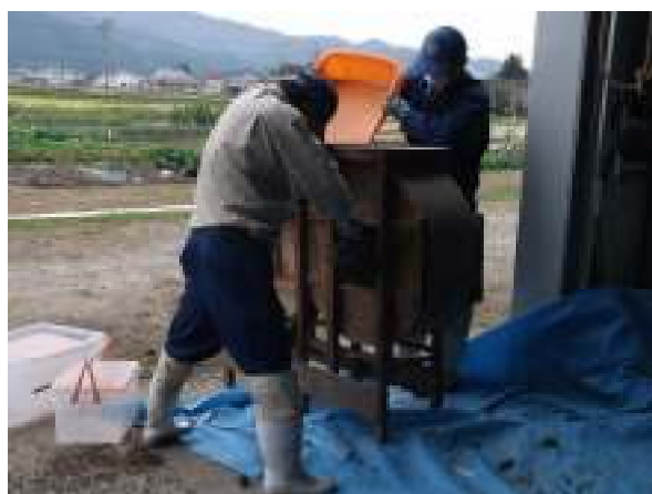
③ 選別・唐箕かけ（10月22日）