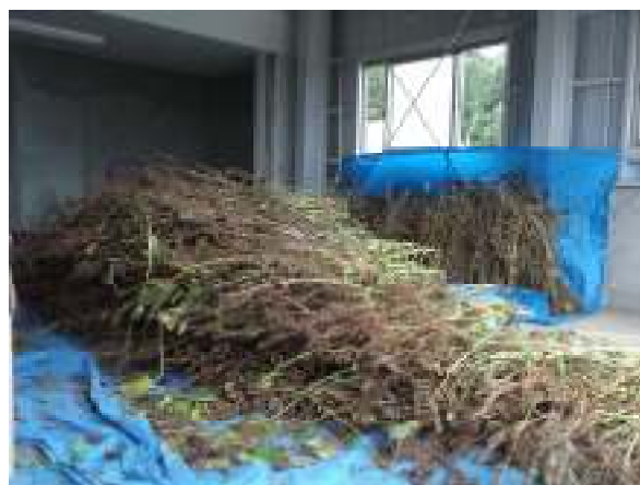
② 収穫されたエゴマ（10月20日）