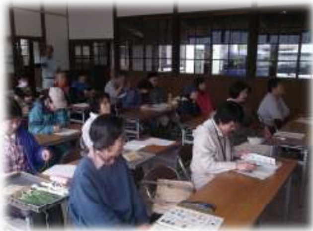
ネギの種類と栽培法についての講義

一つ目の作業は、第1回の講習会で播いたスイートコーンの補植です。前回播種したスイートコーンに10%程度の欠株ができた