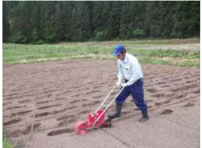
「ごんべえ」によるエゴマの播種作業