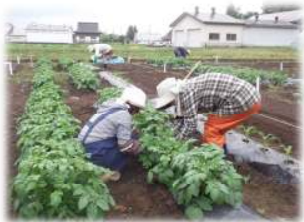
ジャガイモの芽欠きをする受講者

四つ目の作業はネギの定植です。前年の講習会では、秋播きのネギ苗を5月に定植しましたが、今回は3月下旬に播種した春播きのネギ苗を定植しました。ネギを定植する際の注意点は、曲りネギにならないように、ネギを寝かせないで、地表面と直角になるように定植することです。