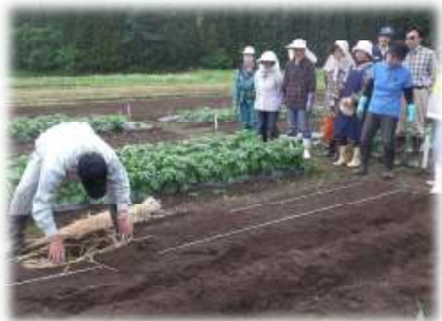
ネギ定植の説明を聞く受講者

二つ目の作業は、ジャガイモの芽欠きです。ジャガイモの芽欠きでは、通常3～4本に芽を整理しますが、今回は時期が遅れたことから、大きく成長したものには手を付けず、弱小茎だけを引き抜きました。