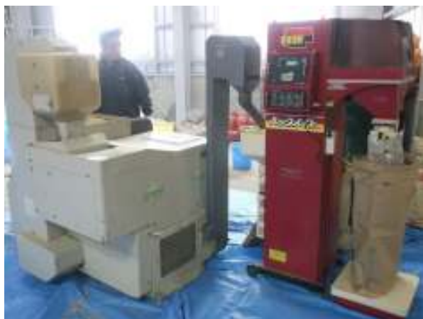
粃摺りと選別作業風景