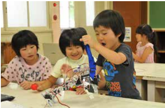
ロボットを操作し、腕立て伏せをさせる児童

長瀬小では7月14日、いわき明星大の高橋義孝准教授を講師に招き、ロボット体験授業が開かれました。同校の科学教育の一環で、1年生と4年生合わせて29人が学びました。1年生は、ロボットが人間社会にどのように役立っているかの説明を聞いた後、パソコンを使って二足歩行ロボットを操作し、ロボットの有用性について学びました。4年生は、鶏の手羽先の関節とロボットの関節を動かしながら比較実験を行いました。