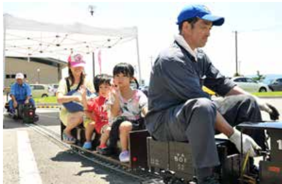
親子連れなどに好評を博したミニSL