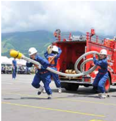
全員が最優秀選手賞を獲得した第5分団のポンプ車操法