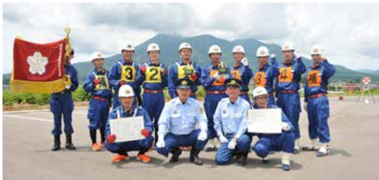
ポンプ車操法、小型ポンプ操法ともに優勝を果たした第5分団