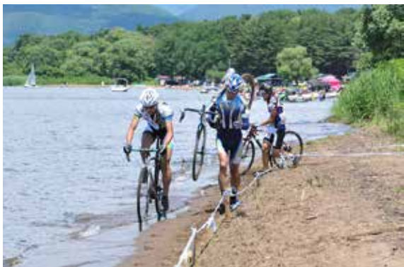
レースに挑む出場者たち

猪苗代湖の天神浜で7月21日、シクロクロスの大会「TOHOKU CX Project JECX サマークロス第2戦」が開かれました。シクロクロスとは、障害物がある不整地の周回コースを走る自転車競技で、ロードレース選手の冬季トレーニングとして始まったもの。この大会には東北や関東から約50人の選手が参加し、林の中や浜辺を駆け抜けました。参加賞として町のブランド米「いなわしろ天のつぶ」が参加者全員に配られました。