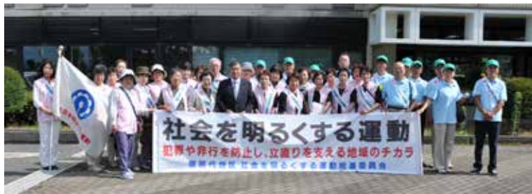
7月15日の広報活動に参加した関係団体の皆さん

「社会を明るくする運動」強調月間の7月、町内では猪苗代地区の保護司会や更生保護女性会などの関係団体により、犯罪のない明るい社会を築くための活動が繰り広げられました。1日早朝にはJR猪苗代駅前では啓発活動を実施。関係団体から参加した約40人がチラシやポケットティッシュなどの啓発グッズを配り、犯罪や非行防止を呼び掛けました。15日には町内で広報活動を展開。広報車で犯罪のない社会づくりを呼び掛けたほか、事業所などを巡回し協力を求めました。