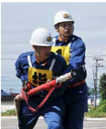
小型ポンプ操法の筒先員交代