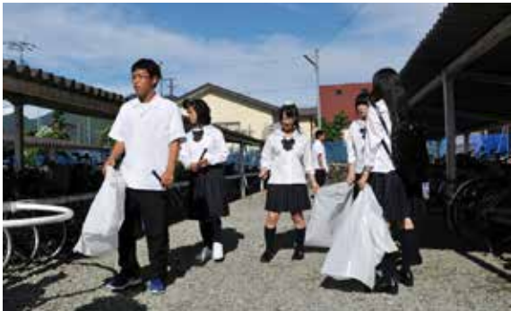
駅前の清掃活動に取り組む生徒