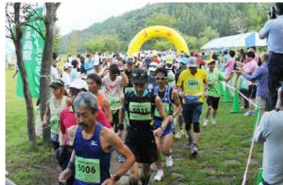
50㌔コースに挑むランナーたち