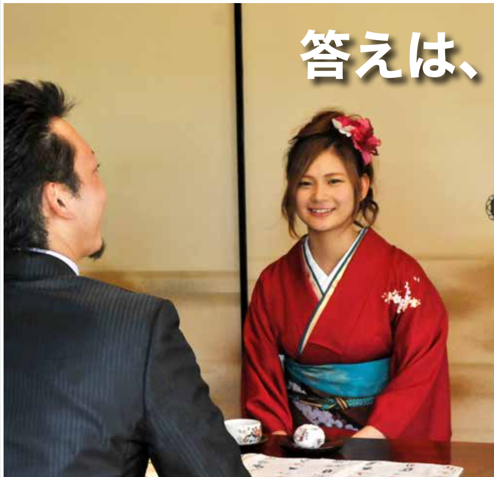
撮影の合間に笑顔を見せる主演の2人