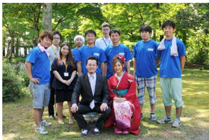
迎賓館での撮影終了後、庭園で記念撮影。皆さんの笑顔に充実感が漂っています。

このCMが流れることで、町を訪れる観光客が増え、特産品の認知度も上がってくれればうれしいです。大賞取るぞー！