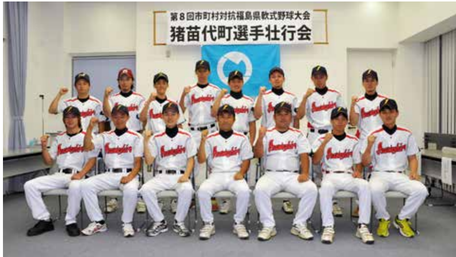
▲壮行会に出席した選手団の皆さん