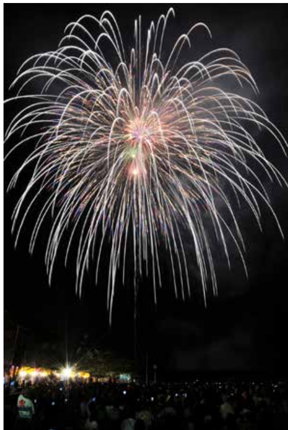
猪苗代の夜空を彩る大輪の花火