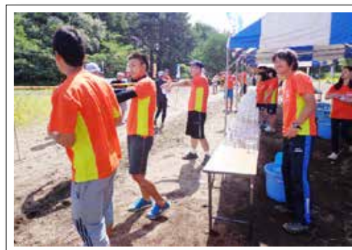
スイムを終えた選手にドリンクを配る生徒たち

町内などで8月24日に開催された第16回うつくしまトライアスロンin あいづには、猪苗代高校のJRC委員会やスキー部などの生徒約20人がボランティアとして参加し、鉄人たちのレースをサポートしました。参加した生徒らは、天神浜で会場設営や受付、給水などを担当。若者らしい爽やかな対応で、過酷なレースに挑む選手たちを元気づけました。