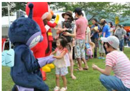
子どもたちも大勢訪れ、イベントなどを満喫していました

いなわしろ花火大会は 8 月 13 日、町運動公園で開かれ、約 3000 発の花火が夜空を鮮やかに彩りました。音楽に合わせて、尺玉やスターマインなどを次々に打ち上げ、会場を訪れた大勢の観客を魅了しました。花火の打ち上げを前に、ステージでは「それいけ！アンパンマンショー」、お笑いトリオ「テンパラ」によるコントなどが繰り広げられ、訪れた家族連れなどが楽しいひとときを過ごしました。帰省先の会津坂下町から訪れたという男性は「音楽と一緒に楽しめるのが、ほかにはない魅力。『アナと雪の女王』の主題歌や『恋するフォーチュンクッキー』が流れると、娘たちが一緒に歌いながら花火を眺めていました」と話しました。