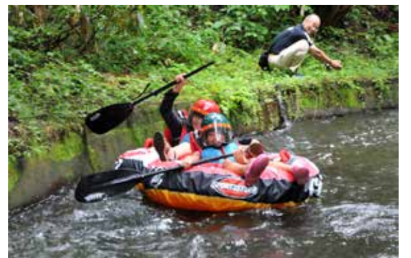
川下りを楽しむ子どもたち

磐梯自然体験教室は8月17日、国立磐梯青少年交流の家などで開かれ、子どもたちが土田堰の川下りを体験しました。この教室は、保科正之公を祭る土津神社と関係が深い土田堰の歴史に触れてもらおうと、猪苗代湖の自然を守る会が開催したものです。子どもたちは、ゴムボートやタイヤチューブに乗って、交流の家近くの約450メートルの区間を何度も下り、自然を満喫しながら堰の歴史を学びました。