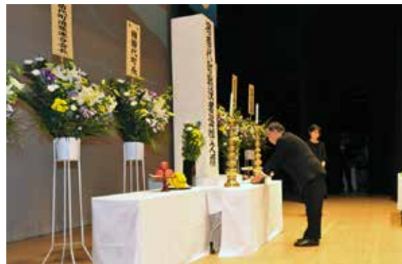
献花をして英霊の冥福を祈る前後町長