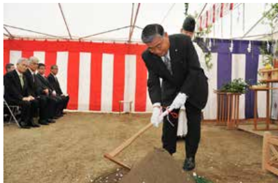
安全祈願祭で鍬入れをする前後町長

町内の磐里字大五百刈に建設予定の（仮称）川西認定こども園の安全祈願祭は8月25日、現地で開かれ、関係者が工事の無事を祈りました。安全祈願祭には約70人が出席。神事で前後町長と施工業者が鍬入れを行った後、関係者が玉串をささげました。幼稚園と保育所それぞれの長所を生かし、安心して子ども預けられる施設として整備される同こども園。来年4月の開園に向けて、いよいよ工事がスタートしました。