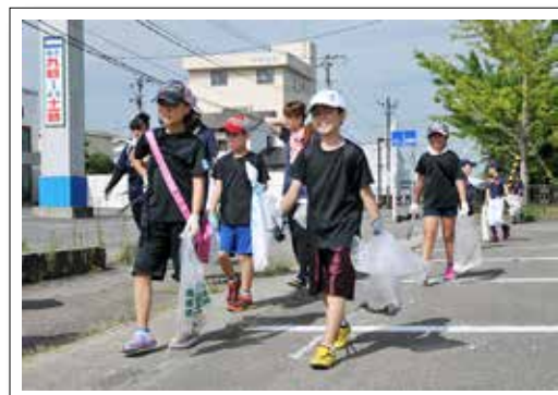
町役場近くを清掃する団員と保護者

さくらこども園では8月8日、年長児たちが野菜を収穫しました。園児たちは、JAあいづ青年連盟猪苗代地区のメンバーたちから手ほどきを受けながら、ピーマンやトウモロコシなどを収穫して、自分たちで育てた作物を収穫する喜びを味わいました。特にピーマンが豊作で、大きいものがゴロゴロ。自分の顔ほどの大きさに育ったピーマンを見て大興奮の様子でした。