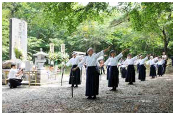
慰霊碑の前で剣舞を奉納する吾妻小の児童

第 15 回県消防操法大会北会津地方大会は 8 月 3 日、会津若松消防署城南分署で開かれました。猪苗代町、磐梯町と会津若松市の消防団が出場し、ポンプ車操法の部と小型ポンプ操法の部で操作の正確さなどを競いました。町の代表として第 5 分団が出場。両部門とも、優勝した会津若松市に惜しくも敗れましたが、4 人が個人賞を受賞するなど、健闘しました。選手の皆さん、サポートした団員の皆さん、長い間本当にお疲れさまでした。