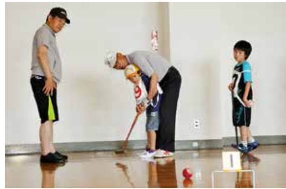
会員の手ほどきを受けながらプレーする子どもたち