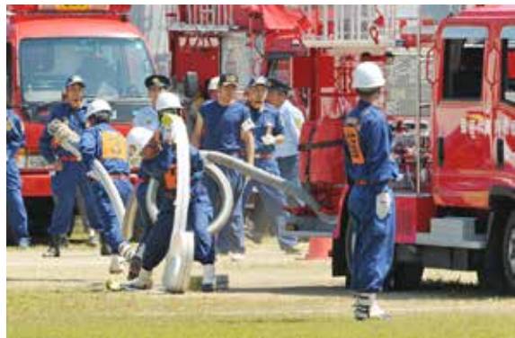
仲間たちが見守る中、全力を尽くす選手たち