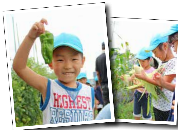
自分たちで育てた野菜を収穫する喜びは格別です