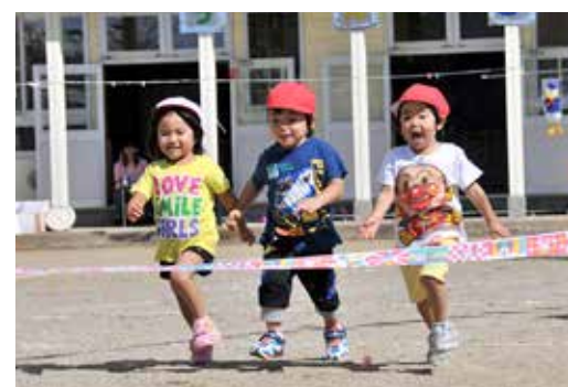
猪苗代保育所のかっこ。ゴールを目指して一目散

猪苗代保育所と中の沢保育所の運動会は9月13日、青空の下、子どもたちの元気いっぱいの行進で始まりました。