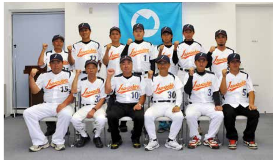
壮行会に出席した選手団の皆さん