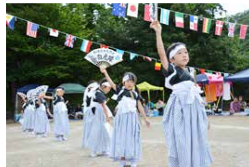
中の沢保育所の園児たちの、気合の入った白虎隊演舞