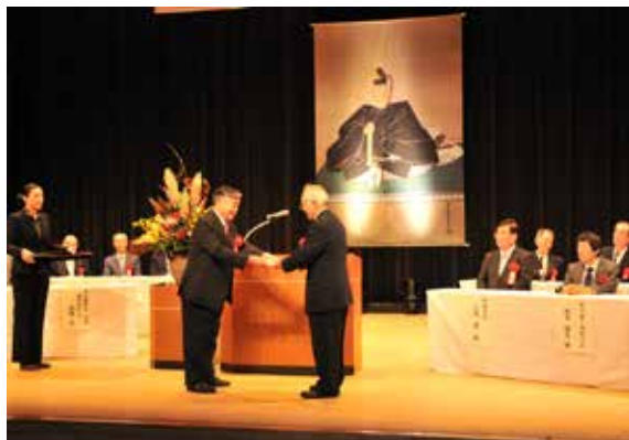
式典で北原会長（右）に署名を手渡す前後町長