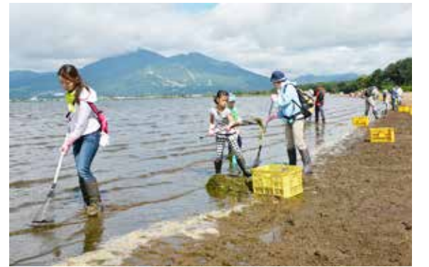
湖岸に打ち上げられた水草を集める参加者たち

「清らかな湖、美しい猪苗代湖の水環境研究協議会」と「ロータリー猪苗代湖水環境協議会」による漂着水草回収活動が天神浜で9月13日に始まりました。腐敗すると水質汚濁の原因となる水草を回収し、湖の水環境を改善するため毎年実施しているもので、今年で5年目になります。この日は約70人が参加し、湖岸に打ち上げられた水草を引き上げ、コンテナに集めました。この活動は11月9日まで、毎週土、日曜日に実施されます。