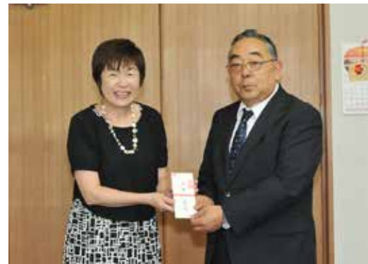
すずらん会ほか有志の皆さん 図書券1万円分

交通事故による死者数は年々減少傾向にあるものの、平成25年の事故発生件数は約63万件、死傷者数は約79万人と、国民の誰もが交通事故の被害者にも加害者にもなり得る極めて深刻な状況です。 自賠責保険・共済は、すべてのクルマ・バイク1台ごとに加入が義務付けられています。加害者の賠償責任を担保することで、被害者の基本的な賠償を保障する制度であり、被害者の救済を目的としています。 自賠責保険・共済なしでの運行は法令違反です。四輪車はもちろんですが、特に車検制度のない250cc以下のバイクは、かけ忘れや有効期限切れにご注意ください。 国土交通省東北運輸局 福島運輸支局 ☎024(546) 0343