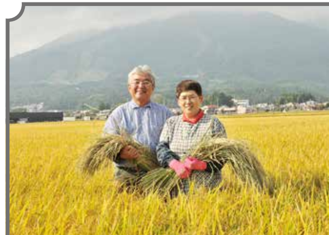
黄金色に輝く稲穂に囲まれ、笑顔を見せる功さん(左)と美千代さん