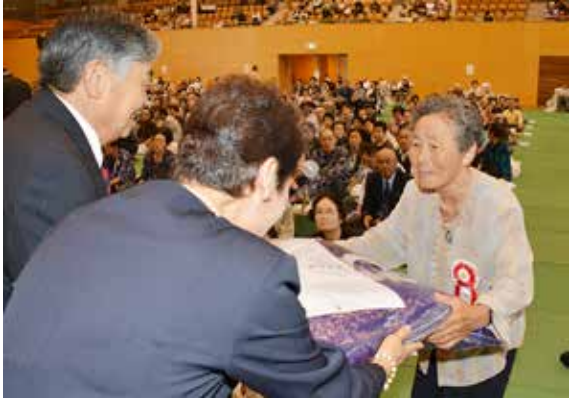
85歳を迎えた人の代表者に座布団が手渡されました