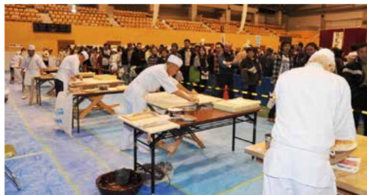
新そば祭りでの実演の様子。私たちと一緒に、祭りを盛り上げませんか