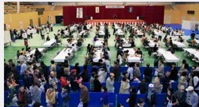
昨年の新そば祭りの様子

今年も新そば祭りを開催します。 猪苗代新そば祭りは、毎年猪苗代でとれた新そばを「ひきたて、うちたて、ゆでたて」で皆さまに召し上がっていただくお祭りです。