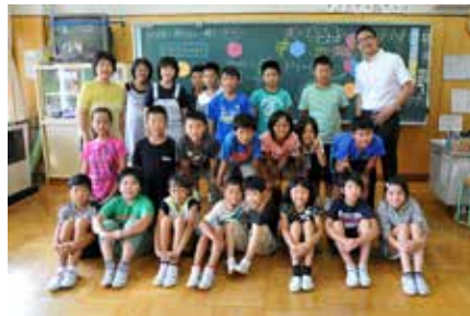
「教える」のではなく「気付かせる」 猪苗代小で算数の授業研究会