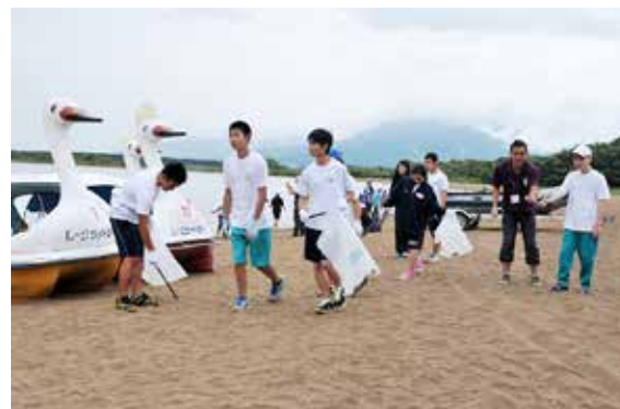
協力してごみを拾い集める生徒

猪苗代町チームの初戦は、10 月 18 日午前 11 時から、相馬市の相馬光陽ソフトボール場で行われます。対戦相手は鮫川村チームです。皆さんの応援をよろしくお願いします。