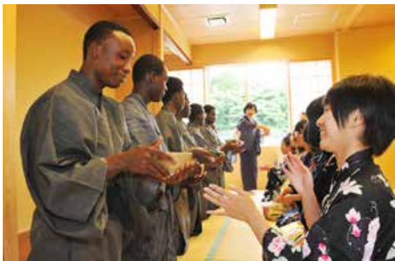
猪苗代高校の生徒からお茶の作法を教わるガーナの高校生

8月26日から9月1日にかけて、ガーナの高校生たちが町を訪問しました。「ガーナよさこい支援会」の支援活動の一環で、3年前にも来町しています。ガーナの高校生たちは滞在期間中、町国際交流協会の会員らの案内で野口記念館などを見学したほか、町内の家庭にホームステイするなどし、町民と交流を深めました。8月27日には猪苗代高校を訪れ、生徒たちと一緒に体育の授業に参加したり、浴衣に着替えて茶道の体験をしました。