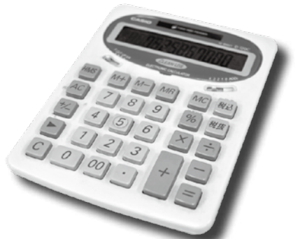
平成 25 年度歳入歳出決算額および対前年度比較表