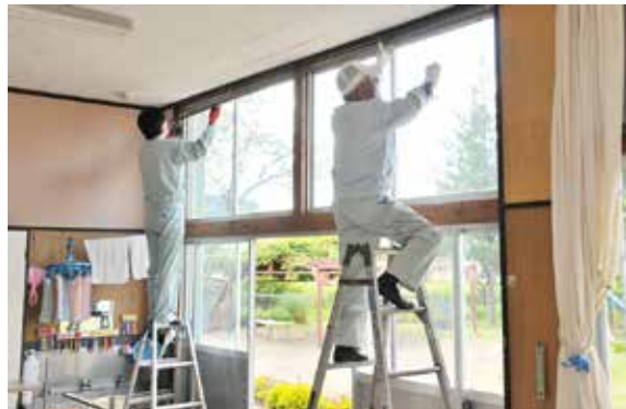
猪苗代幼稚園のカーテンレールを交換する会員の皆さん