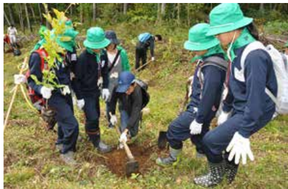
植樹に取り組む猪苗代小の児童