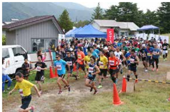
勢いよくスタートする参加者

ゲレンデ逆走マラソンの今シーズン第5戦は10月4日、ばんだい×2スキー場で開かれ、約200人が健脚を競いました。「3時間の周回数を争う耐久レース」という厳しい内容に参加者も苦戦しましたが、ランナーズピットでお菓子やお茶を補給し、元気に頑張っていました。スキーリゾートふくしま創造会議によるおもてなしや福島医療専門学校のマッサージサービスなども好評で、ランナーたちは秋晴れの中、初秋の空気を満喫していました。