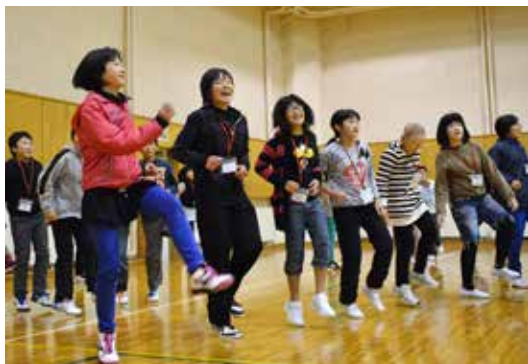
最終日の前夜は、ボランティアが企画したゲームやダンスなどを楽しみました

夕食後の「お楽しみ会」が特に楽しかったです。家に帰れないので最初はさみしかったけど、友達もたくさんでき、全然さみしくなくなりました。もう一泊ぐらいしたかったです。来年もまた参加します。