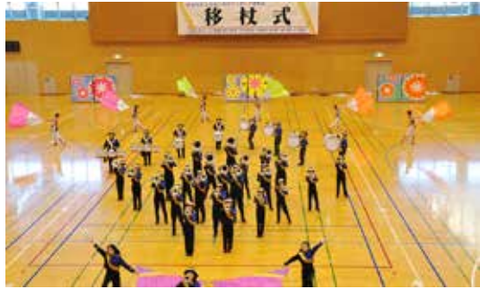
移杖式で見事な演奏を披露する児童