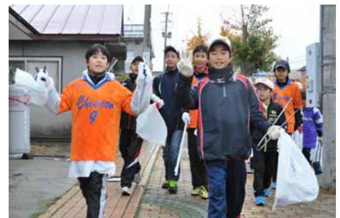
雨にも負けず、笑顔で清掃活動に取り組みました

千里スポーツ少年団による清掃活動は11月1日、同校周辺で行われました。活動には、団員、保護者や指導者など合わせて約100人が参加。同校から猪苗代駅までの間を歩き、空き缶やペットボトル、たばこの吸い殻などを拾い、環境美化に努めました。 当日はあいにくの天気となりましたが、子どもたちは雨に濡れながらも熱心にごみを拾い集めていました。