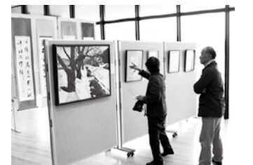
かわいらしい山野草の鉢植えと迫力ある書画をお楽しみください