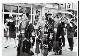
写真は一昨年のおシンさんの嫁入りの様子