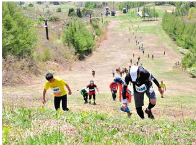
蛇行しながらコース終盤の急なゲレンデを登る選手たち。中には手をつきながら登る人も