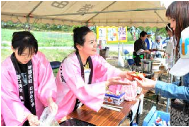
お客さんにこづゆを振る舞う星会長(左から2人目)