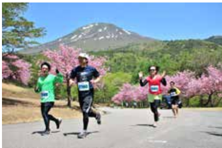
天鏡台を駆け抜ける10キロの部の参加者。レースはまだ序盤。笑顔を見せる余裕もあります。

ゲレンデ逆走マラソンは、「GAMBARUZO! ふくしま実行委員会」が東京電力福島第一原発事故の風評被害払拭などを目的に2011年から開催していて、今季は町内の6スキー場を舞台に全6戦が繰り広げられます。