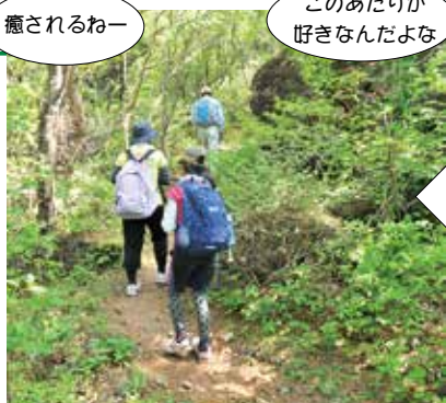
ゲレンデの後は新緑のトンネル