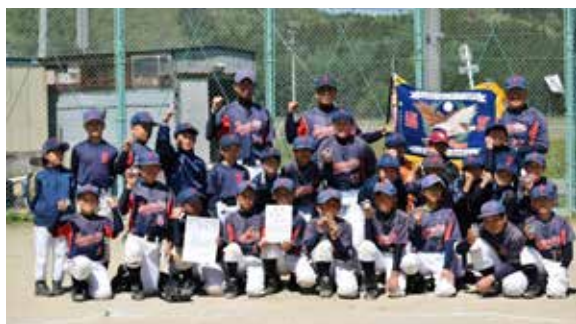
◀初優勝を果たした猪苗代 スポーツ少年団

現在、「リバースジュニア」「リバース」共にメンバーを大募集していますので、活動に興味を持たれましたらお気軽にお問い合わせください。女子メンバーやマネージャーも募集中です。ご連絡お待ちしております！