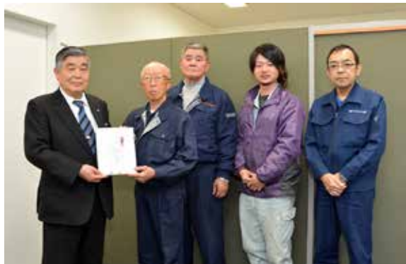
前後町長に図書券を手渡す大友組合長(左から2人目)ら