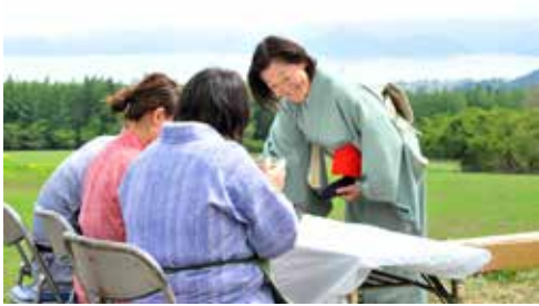
猪苗代湖を眺めながらいただくお茶は格別です