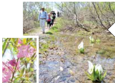
ミズバショウなどの花がお出迎え