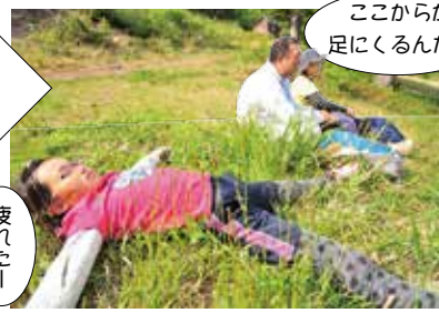
最後の難関、ゲレンデ突入を前に一休み