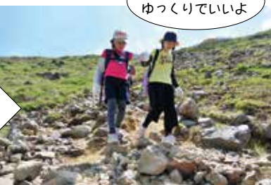
慎重に岩場を下ります