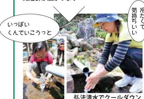
弘法清水でクールダウン