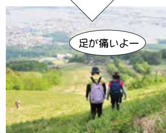
ゴールまであと少し。頑張って!