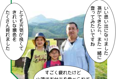
すごく疲れたけど山頂でお弁当を食われてよかったです