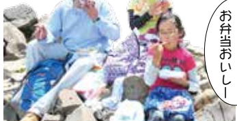
山頂で食べるお弁当の味は格別