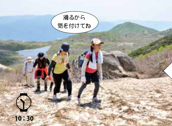
登山道に残る雪がみんなの体力を奪います