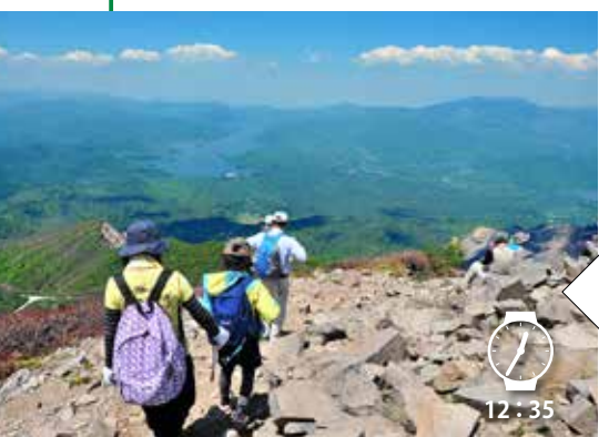
下山開始。眼下には桧原湖など、裏磐梯の湖沼群が広がります