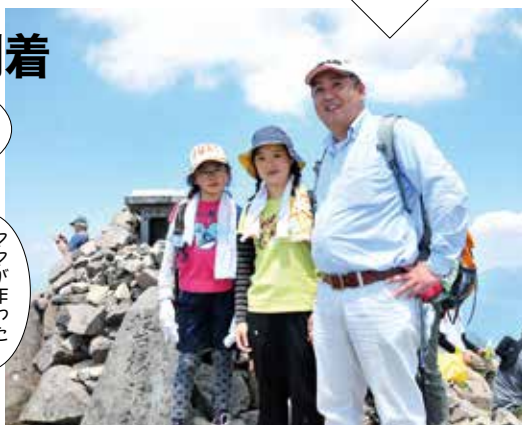
山頂に到着。達成感に満ちた爽やかな笑顔