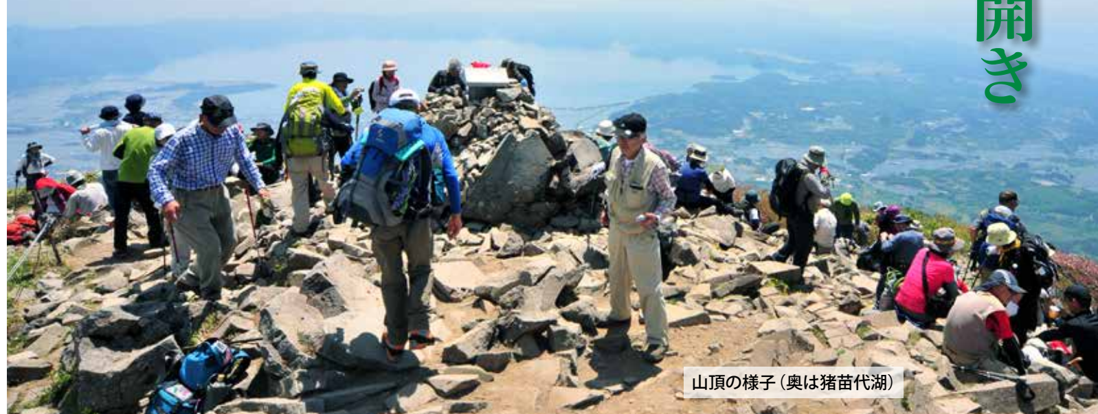
山頂の様子(奥は猪苗代湖)

山頂手前の弘法清水では、青空郵便局が開局。登山者は、絶景を見た感動などをはがきにしたため、臨時のポストに投函していました。