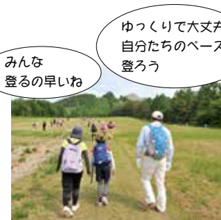
登山開始。しばらくスキー場のゲレンデを登ります