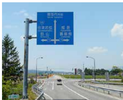
インターチェンジを下りた所にある案内標識

いさつするよう心掛けておりますが、相手に伝わらないあいさつでは意味がありませんので、今後にもこやかにあいさつを続けてまいります。 ④どの利用者の方にも偏見を持つて対応することはありませんが、不快な思いをさせてしまい、大変申し訳ありませんでした。これからも町民の皆さまに気持ちよく利用していただけるよう努めてまいります。 生涯学習課 図書歴史情報館 ☎ (23) 7855 ●町内に観光案内表示が必要。早急に設置してほしい 【ご意見】 町内に観光案内表示を設置してほしいという意見は、今までに何回か出されているものの、改善が見られません。 広報の 5 月号にも意見が掲載されていました。道が駅がオープンするまでの間、お待ちくださいとの回答でした。道の駅と案内表示がどう関係するのでしょうか。 これまで、条例による規制があるためできない、ホームページで対応するとの回答ばかりでしたが、これで良いとはとても思えません。他の市町村と比べると、やる気がないのでしょうか。