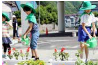
プランターに植えた花に水をやる吾妻小緑の少年団の団員たち