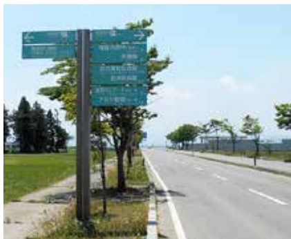
サイン計画により整備した誘導サイン

町民意見箱「ご意見箱」は役場庁舎、カメリーナ、学びいな和みいなに設置しています。 より良いまちづくりのため、皆さんの建設的なご意見をお寄せください (郵送や FAX でも受け付けます)。 ▼回答方法 広報猪苗代で回答 ▼記入にあたってのお願い ・ご意見は内容の趣旨がわかるように、具体的に記入いただくようお願いいたします。 ・他人を誹謗、中傷するものはご遠慮ください。 ▼送付・問い合わせ先 総務課 秘書広報係 ☎ (62) 2111 FAX (62) 5175