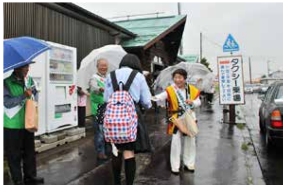
JR猪苗代駅前で啓発グッズを配る参加者