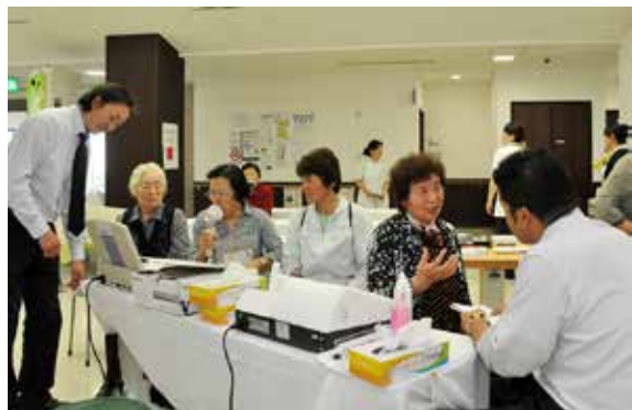
肺活量などの健康チェックを受ける来院者