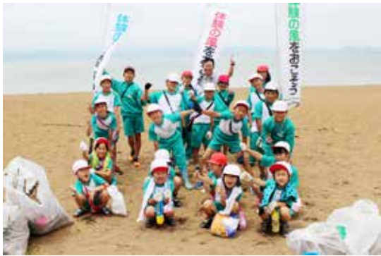
湖畔の清掃に取り組んだ緑小の児童ら