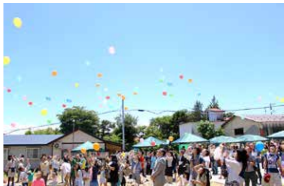
風船を飛ばして一周年を祝う来館者たち

町内新町にある「はじまりの美術館」の開館一周年記念祭は6月7日、同館で開かれました。同館は、明治初期に建てられた酒蔵「十八間蔵」を改修し、昨年6月1日にオープン。専門的に芸術を学んでいない人の自由な芸術表現「アール・ブリュット」作品を中心に展示しています。記念祭では、式典が行われたほか、アートワークショップやトークイベントなども繰り広げられました。会場には出店も並び、多くの家族連れなどでにぎわいました。