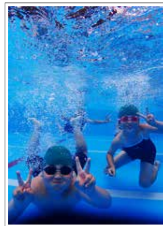
【撮影日】 6月30日 【撮影場所】 緑小学校

6月、町内の各小学校でプール開きが行われ、子どもたちが待ちに待った水泳の授業が始まりました。この日は一日中くもり空で、子どもたちは「寒い」「冷たい」と言いながらも大好きなプールを思いっきり楽しんでいました。