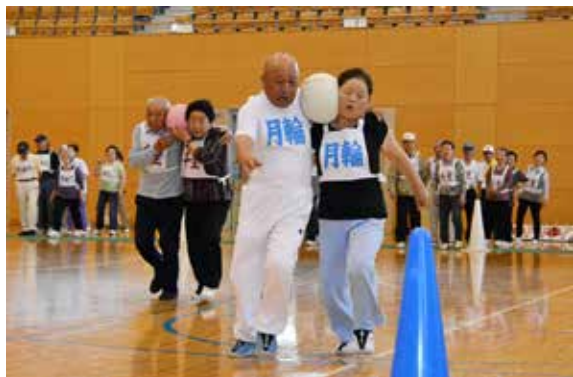
顔でボールをはさんでリレーする「きみといつでも」

町高齢者スポーツ大会は6月12日、カメリーナで開催されました。大会には、町内6地区から約219人が参加。1人のモデルをみんなで着替えさせる「ファッションショー」、キンボールという大玉を転がす「キン転がし」やラグビーボールを棒で転がして進む「豚追い競走」など12種目に挑み、仲間たちと一緒に心地よい汗を流しました。地区別では、翁島地区が優勝、吾妻地区が準優勝でした。