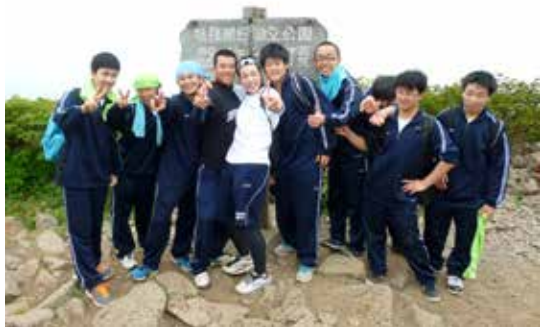
山頂で記念撮影する生徒たち

猪苗代高校の全校生徒は 6 月 3 日、磐梯登山を実施しました。磐梯登山は、1977（昭和 52）年から続く同校の伝統行事で、当日は生徒 154 人が参加。八方台登山口から登り、猪苗代スキー場へと下山しました。弘法清水から山頂までは希望する生徒が登り、135 人が山頂を目指しました。あいにくの雨模様で、雄大な景色を眼下に望むことはできなかったものの、登頂した生徒たちは達成感に満ちた笑顔で友人らと記念撮影していました。