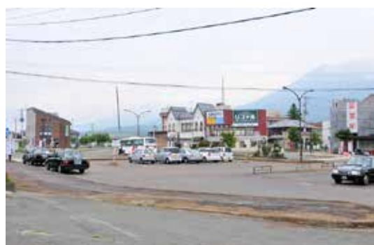
再整備を検討中のJR猪苗代駅前