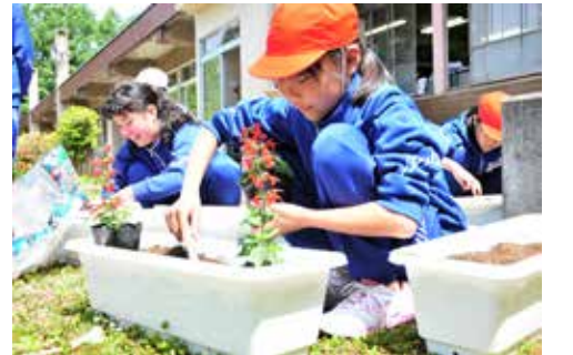
プランターに花の苗を植える長瀬小の児童