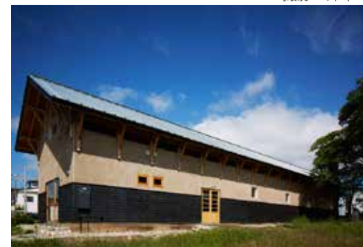
はじまりの美術館