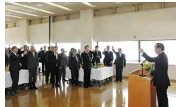
昨年の新年あいさつ交歓会の様子

平成28年の年頭に、さらなる町政進展を誓うため「新年あいさつ交歓会」を開催いたします。どなたでも参加できます。多くの皆様のご参加をお待ちしております。 ▼日時 1月4日(月) 午前11時 ▼場所 町役場3階 正庁 ▼会費 500円 ▼問い合わせ先 総務課 秘書広報係 ☎(62)2111