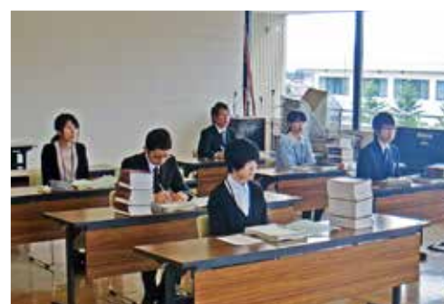
真剣な表情で研修を受ける新採用職員