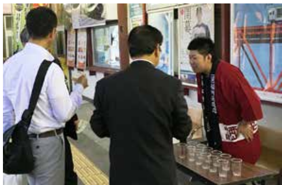
好評を博した稲川酒造の「七重郎」と「百十五」の試飲

お座敷列車「ふるさと」は5月21日、JR磐越西線会津若松駅～猪苗代駅間で運行されました。この列車は、4月から6月まで開催されているアフターDCを盛り上げようと企画され、「呑んべえ会津地酒列車の旅」として参加者を募集。3両編成のお座敷列車に86名が乗車しました。猪苗代駅では、稲川酒造の地酒の試飲やとん汁の振る舞い、ご当地キャラ「ひでよくん」による出迎えなど、乗客へのおもてなしが行われました。