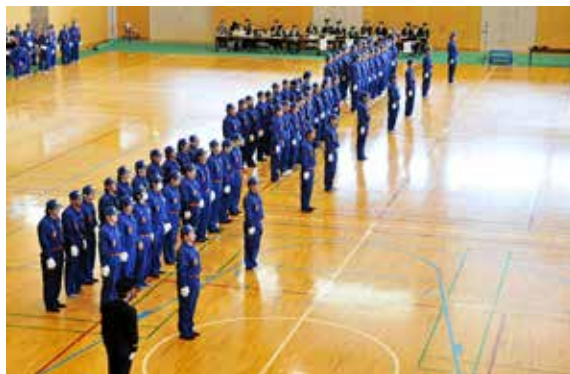
きびきびとした態度で中隊訓練を行う消防団員ら

各分団による小隊訓練と中隊訓練も行われ、団員らはきびきびとした態度で臨み、日ごろの訓練の成果を披露しました。