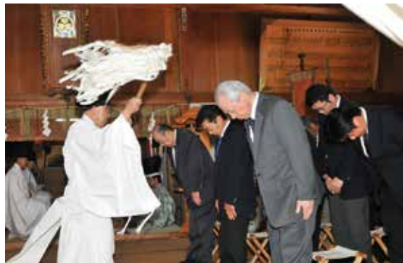
神事に臨む氏子ら関係者