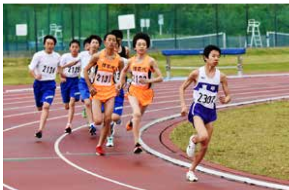
共通男子3000㍍で力走する選手

自己ベストを目指して全力を尽くす姿に、生徒や保護者から大きな声援が送られました。