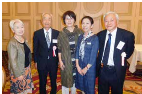
ふるさとに思いをはせ、交流を深める参加者