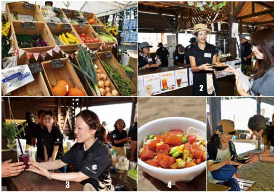
1_猪苗代市場の新鮮野菜 2_賑わいをみせた猪苗代食堂 3_地元産品を使ったオリジナルカクテルも人気 4_農家レストラン結の創作冷かけそば 5_お客さんも自然に笑顔に

イベントでは、私たちが愛情を込め、自信を持って生産した米や野菜を多くの人に食べてもらうことができ、とても嬉しく思っています。私は、オハラ☆ブレイクに参加することができ、町の若者たちは大きなチャンスをいただいたと考えています。猪苗代に住んでいてよかったと少しでも思えるように、仲間たちと取り組んでいきたいです。