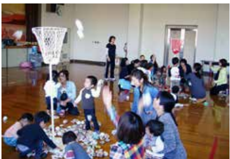
「ちびっこランド」で、一緒に楽しい時間を過ごしませんか