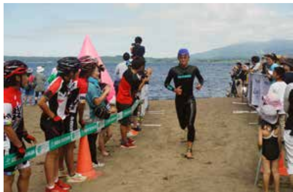
沿道の声援を受けて天神浜をスタートする選手