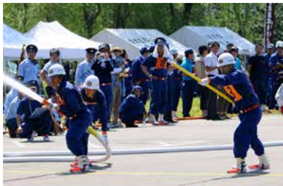
高得点を叩き出した第5分団のポンプ車操法

第16回県消防協会北会津地方消防操法大会は8月7日、町水防センター西側駐車場で開かれました。猪苗代町、磐梯町、会津若松市の消防団の代表チームが出場し、ポンプ車操法の部と小型ポンプ操法の部で操作の正確性などを競いました。ポンプ車操法の部では、第5分団が高得点を叩き出して優勝。小型ポンプ操法の部では、第6分団が準優勝し、町の代表が両部門で活躍しました。優勝した第5分団は、福島市で開かれる県大会に出場します。