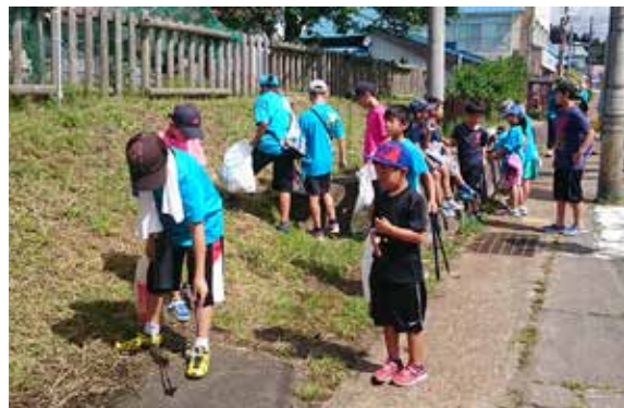
真剣に清掃活動を行う児童ら

同スポーツ少年団では、毎年8月に清掃活動を実施し、町の美化保全のために取り組んでいます。参加者は「これからも町をきれいにしていきたい」と話しました。