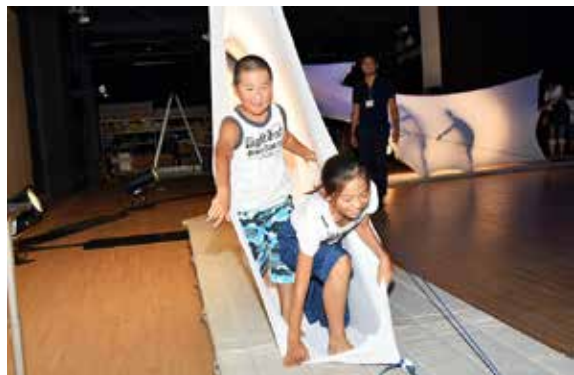
「スペース・チューブ」を体験する子どもたち

町と東京学芸大の地域協定締結によるイベント「学びーなであそびーな」は8月12、13の両日、学びいなで開かれました。会場には、子どもたちの想像力を養う遊具や布で作られたスペース・チューブというトンネルが設置され、多くの家族連れなどでにぎわいました。スペース・チューブは、舞台用の1枚の布で作られた白いトンネルで、子どもたちは「ふわふわ」「ゆらゆら」とした不思議な感覚に歓声をあげていました。