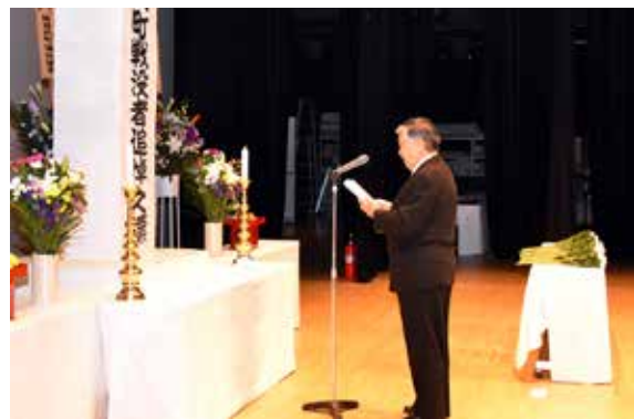
追悼式で式辞を述べる前後町長