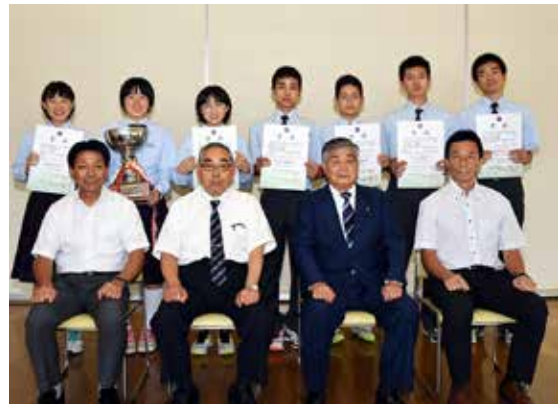
結果の報告に訪れた特設バドミントン部の選手ら