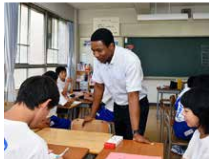
中学校で英語を教えるセイラム先生