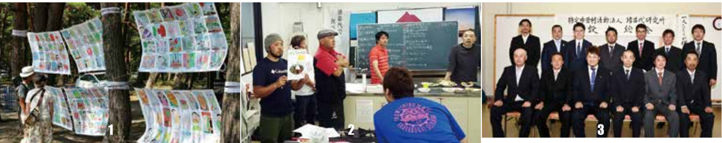
1_会場には町の子どもたちが書いた絵画が展示された 2_活発な意見が飛び交った試食会 3_猪苗代研究所設立総会

猪苗代食堂の隣には、採れたての新鮮野菜や果物を販売する「猪苗代市場」を開設。JA会津よつば青年連盟猪苗代地区（農青連）のメンバーらが生産したトマトやキュウリなど、地元産の新鮮な野菜を買い求める来場者でにぎわいました。