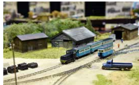
当時ののどかな風景を再現した鉄道ジオラマ