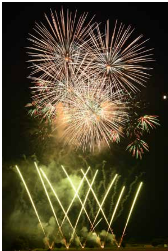
猪苗代の夏の夜空を彩った大輪の花火