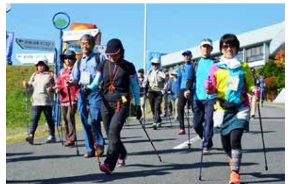
ノルディックポールを手にして歩く参加者

第6回猪苗代ノルディックウォーキング大会は10月15日、国立磐梯青少年交流の家をスタート・ゴールとするコースで開かれました。猪苗代青年会議所が猪苗代の素晴らしい風景を楽しみながら、健康づくりに親しんでもらうため開催。町内外から約150人が参加しました。天鏡台や土津神社などを巡る5㌔、8㌔、12㌔の3コースで練り広げられ、参加者は猪苗代の秋を楽しみながら爽やかな汗を流しました。