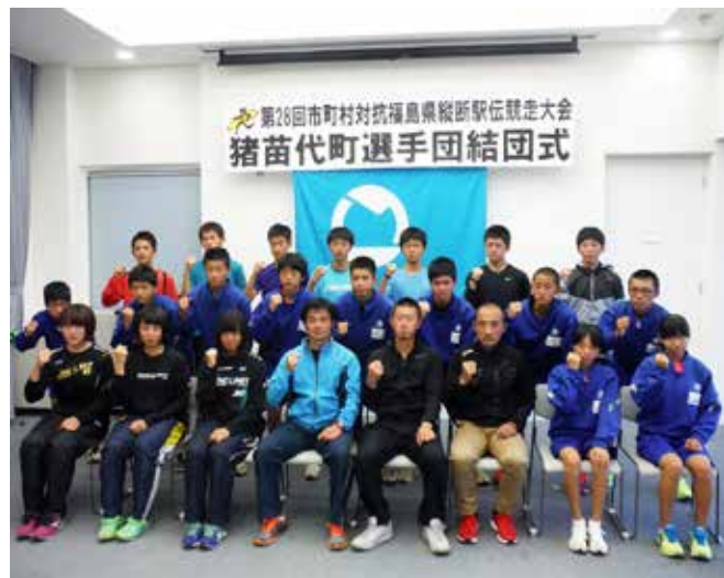
町の部優勝を目指して活躍を誓う選手ら