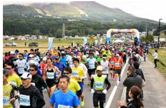
ハーフマラソン部門をスタートする参加者