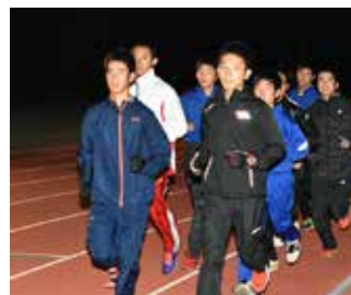
夜間も練習に取り組む選手