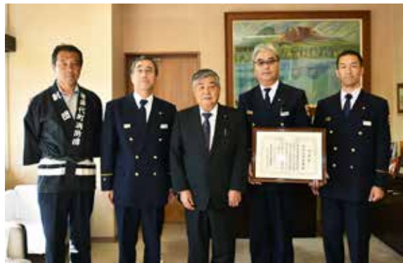
受賞の報告に訪れた鈴木署長(左から2人目)ら