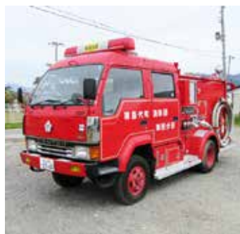
公売する消防ポンプ車