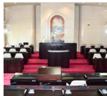
猪苗代町議場（町役場 3 階）

議会の本会議は一般に公開されており、どなたでも傍聴することが出来ます。議場は町役場 3 階です。傍聴する人は、傍聴席入口にある受付簿に住所・氏名・年齢を記入し入場してください。