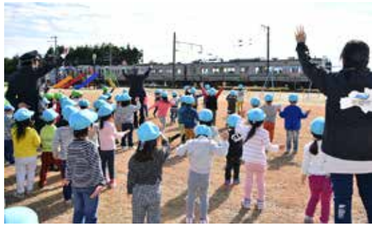
列車に向かって手を振る園児ら