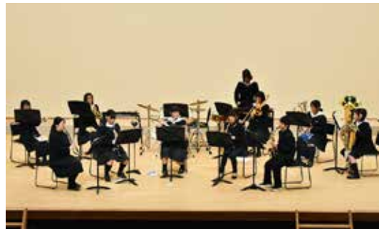
日ごろの練習の成果を披露する部員ら