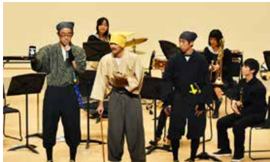
会場を大いに盛り上げる「黄門様御一行」