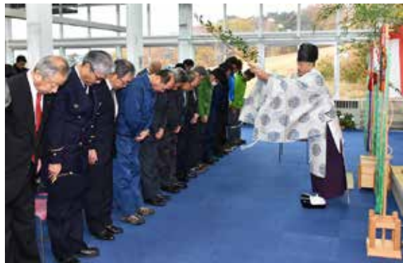
神事を執り行う関係者ら