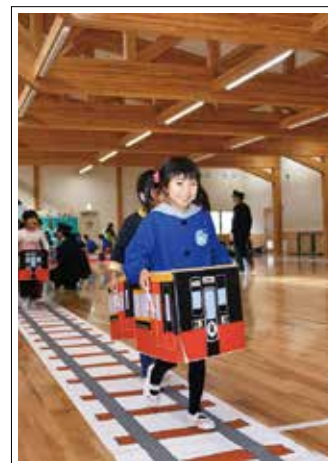
【撮影日】 11月2日 【撮影場所】 ひまわりこども園

ひまわりこども園で行われたJR社員との交流会での一コマ。段ボールで作った特製の電車で楽しく電車ごっこ。園児は、本物の運転手さんや車掌さんと一緒に、鉄道について学びました。(関連15ページ)