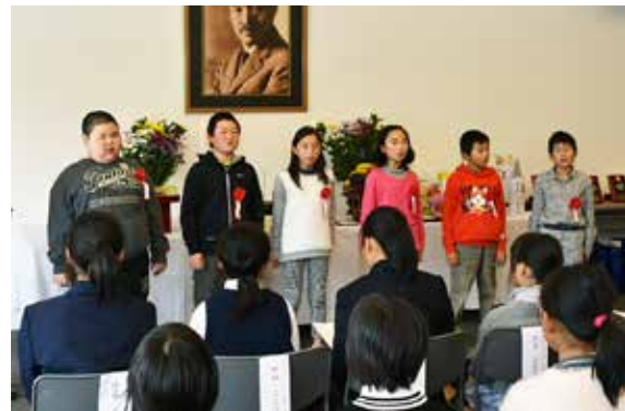
「野口英世の歌」を披露する翁島小 4 年生児童

野口英世記念会の八子弥寿男理事長が「野口博士の功績を後世に伝えていきたい」とあいさつ。土屋重憲教育長、後藤公男町議会副議長が祝辞を述べました。また、翁島小学校の 4 年生が唱歌「野口英世の歌」を披露しました。