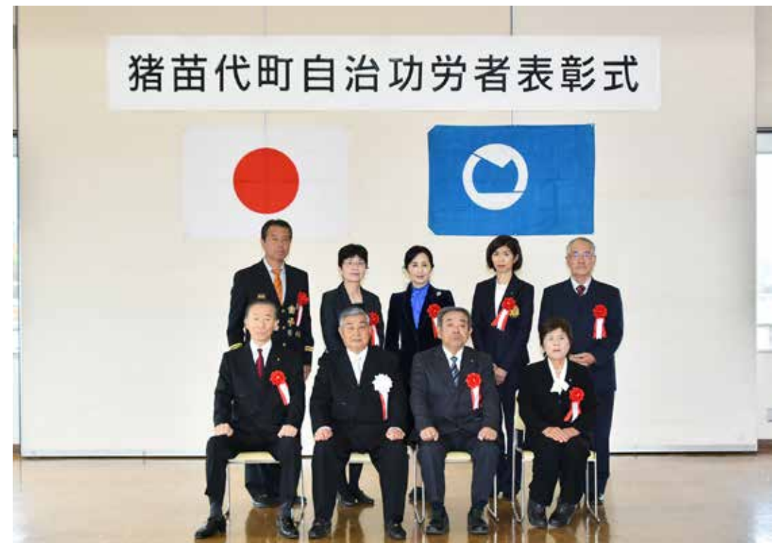
前後町長（前列左から2人目）と記念撮影する受賞者の皆さん

平成28年度町自治功労者表彰式は11月3日、町役場で行われました。町議会議員として功績のあった有功者4人と自治、教育、消防の分野で公共の福祉や町政に功労のあった4人、並びに寄付をされた善行者4人を表彰し、その功績をたたえました。