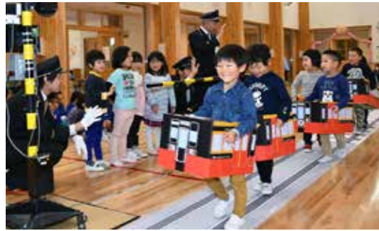
模擬レールを進んで電車ごっこを楽しむ園児