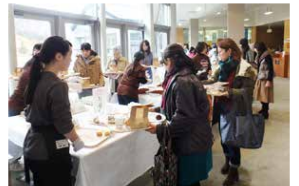
用意されたスイーツを選ぶ来場者

当日は、お菓子作り体験やあめ細工の実演、音楽ユニット「C i e l」による生演奏なども行われました。