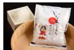
いなわしろ天のつぶ