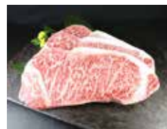
猪苗代町産会津牛 サーロインステーキ