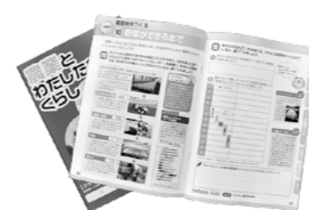
写真上 猪苗代小学校5年生の中村さん（中央）に補助教材を手渡す鹿目専務（左）と見守る久米本校長（右） 写真下 町内の5年生に配布された補助教材「農業とわたしたちの暮らし」