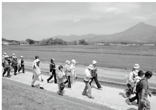
磐梯山を眺めながらゴールを目指す参加者ら

音楽、スポーツや食のイベントを通して、本県の素晴らしさを内外に発信するイベント「GAMBARUZO! ふくしま 2 Days in いなわしろ」は6月4、5の両日、ホテルリステル猪苗代をメイン会場に開催されました。溝畑 ひつし 宏観光庁長官やしゃくなげ大使の福留 のりお 功男さんも参加した猪苗代湖畔チャリティーウォーク、元BOØWYのドラマー高橋まことさんをホストに開催した「GAMBARUZO! ライブ」、フリースタイルスキー世界選手権猪苗代大会のモーグル会場を逆走するマラソン大会、ふくしま物産展や花火大会などに多くの人が訪れ、イベントを満喫しました。