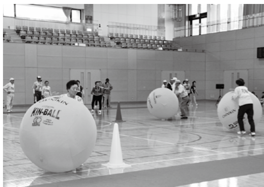
元気いっぱいな様子でキン転がしに挑む参加者ら

町高齢者スポーツ大会は6月17日、カメリーナで開催されました。町と町老人クラブ連合会が主催するこの大会には、町内6地区から約250人が出場、各地区の参加者から仲間に対する声援が上がり、カメリーナ中に響き渡りました。