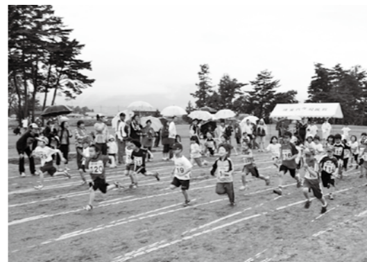
雨の中を元気いっぱいに走る小学生たち

23年度の町民健康マラソン大会は6月26日、町民運動公園で開かれ、小・中学生を中心に468人が健脚を競いました。