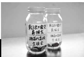
写真上 全校生を代表し、津金町長に浄財を手渡す大川原生徒会長（左から2人目）、武藤委員長（同4人目）ら5人の生徒代表 写真下 猪苗代高校の善意が詰まった義援金の一部