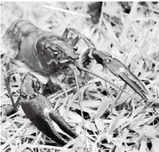
ウチダザリガニは、持ち帰り家で飼育することも禁止です。

体長は15センチ前後で体型はがっしり。第1胸脚(はさみ脚)の可動肢の付け根に白い模様があります。また、本州で採取されるザリガニのほとんどはアメリカザリガニで、規制の対象にはなりません。