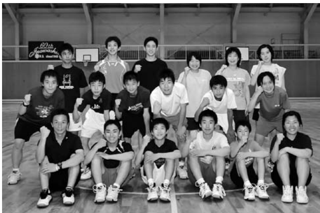
チームが一丸となって8月の全中制覇を目指す