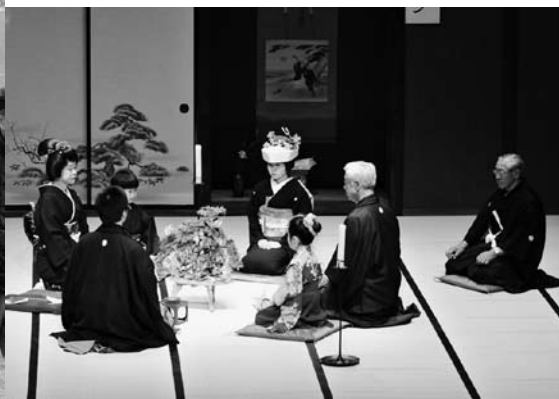
写真左 小雨が降る中、亀ヶ城公園を進む嫁入り行列を、多くの観客が取り囲んだ 写真上 学びいなでは結びの儀式が再現された