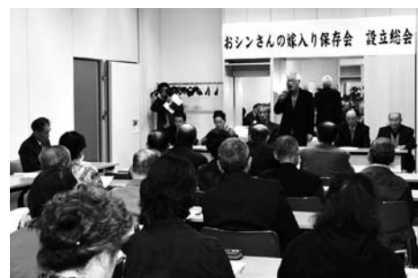
「おシンさんの嫁入り保存会」設立総会の様子

「この町の伝統を、文化を守りたい」 「この人たちのために何かできることを」 「いつか古里に戻る日まで」 いろいろな想いで、人と人がつながる。 人と人とのつながりには、想像を超える力がある。 そのつながりを大切に育てるように、糸を紡いでいこう。 お互いに寄り添い、助け合いながら、共に歩いていくために