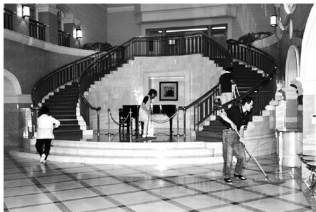
館内の清掃は当番制。住民全員が交代で毎日清掃を実施する

飯館村の蔵平地区は、福島第一原発から30キロ圏内に位置し、計画的避難区域に指定された。地区の住民約140人のうち、半数近くが現在もホテルブルミエール箕輪で避難生活を送っている。 自分たちが生活するホテルの清掃や地区の空き巣被害を防ぐ見回り活動など、一緒に行動することを通して、地域で心を一つにし、この難局を乗り切ろうと思っている。 二次避難先はどこになるかわからないが、それぞれの仕事などの都合もあり、地区住民がまとまって移動するのは難しいというのが現状だ。 しかし、こんなときだからこそ、地域のつながりを無くしてはならないと思う。借り上げアパートや仮設住宅など、これから離れ離れになっても、お互いに連絡を取っていききたいと話している。