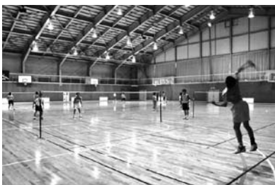
猪苗代中学校 富岡第一中学校バドミントン部