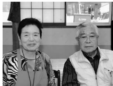
浪江町から避難 祭りを手伝った

地元を懐かしんでくる人たちのためにボランティアで参加した。イベントなどに参加することで、人に会えるし、新しいつながりも生まれる。なみえ焼きそばを食べて、浪江を懐かしんで、元氣を出してもらいたい。