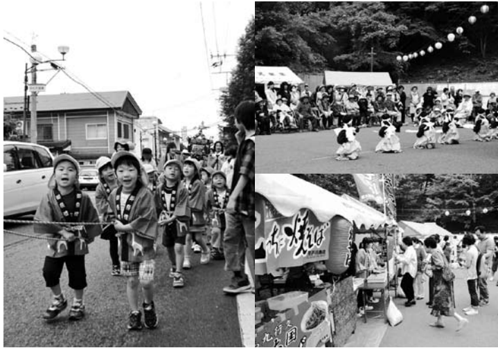
写真左 小学生未満の子どもたちによるちびっこみこし 写真上 中の沢保育所の園児らによる白虎隊剣舞 写真下 700食を振る舞ったなみえ焼きそばには長い行列ができた 写真右 温泉祭りのメインイベントの一つ、温泉踊り。地区住民と避難者が一体となって踊った