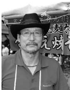
浪江名物なみえ焼きそばを振る舞った