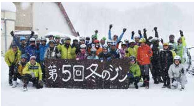
5回目の開催となった「冬のジン」には県内外から参加者が集結