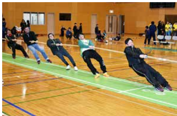
全力を尽くして競技に取り組む参加者

主な成績は次のとおりです。【一般男子】①若宮会2②南相馬TC③佐原っ子お助け隊【一般男女混合】①若宮会②行仁綱引クラブ③チーム梨木【ジュニア】①湯川男子ソフトスポ少②猪苗代スポ少A③チビタンスピリッツ