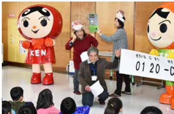
相談電話の掛け方を説明する人権擁護委員ら

若松人権擁護委員協議会猪苗代地区は2月20日、吾妻小学校で人権教室を開きました。人権擁護委員と一緒にイメージキャラクターの「人KENまもる君」と「人KENあゆみちゃん」が登場。子どもたちは、みんなの命を守るために、困っていることがあれば誰かに相談することや、他人の気持ちになって思いやることの大切さなどを学びました。また、人権擁護委員が「子どもの人権110番」に電話する方法を丁寧に説明しました。