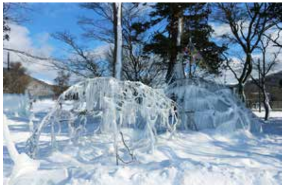
校庭の遊具などを利用して作られた「森の氷本アート」