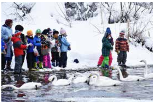
猪苗代湖北岸で白鳥を観察する児童ら