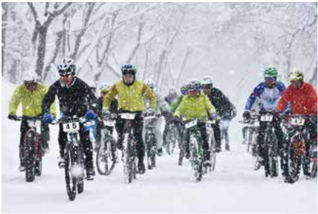
降りしきる雪の中、勢いよくスタートする選手たち