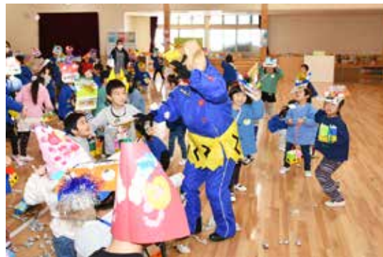
元気に豆まきをする園児たち

同園のホールで園児たちが豆まきの練習をしていると、鬼に扮した先生が登場。園児たちは大きな声で「鬼は外、福は内」と新聞紙で作った豆をまき、こども園から鬼を退治しました。