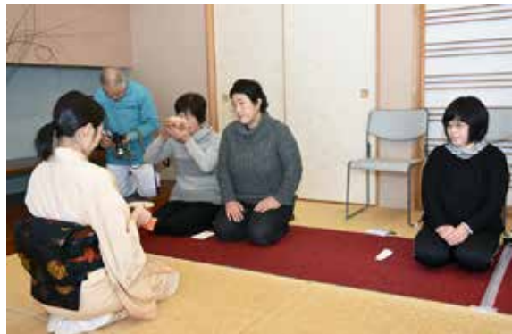
茶の湯を楽しむ来場者ら