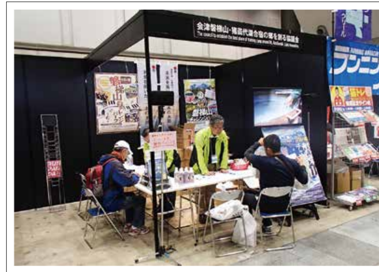
磐梯山周辺の魅力を紹介する協議会のブース

「東京マラソンEXPO 2017」は、日本最大級のランニングイベントで、東京マラソンに出場するランナー3万6千人を含め、全国や海外から11万人以上が会場を訪れました。会場には、各地域の魅力を紹介するブースが設置されたほか、スポーツに関する最新グッズの販売やさまざまなサービスの体験コーナーなどが設けられ、多くの人で賑わいました。