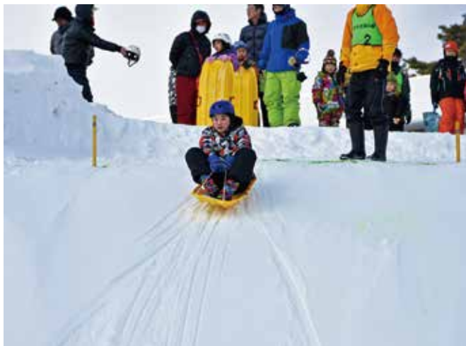
特設のゲレンデでそり滑りを楽しむ来場者