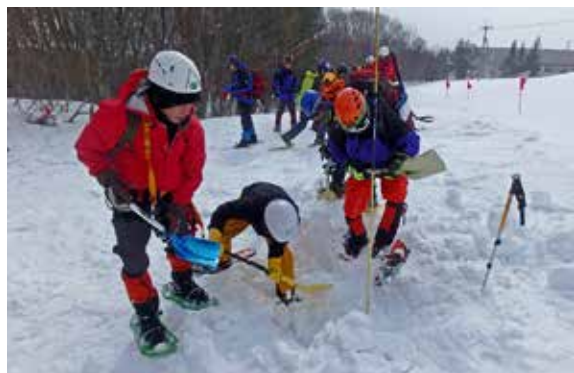
雪崩に巻き込まれたことを想定して訓練する参加者

町山岳会、警察署や消防署などで組織する猪苗代地区山岳遭難対策協議会は2月24日、猪苗代スキー場中央で冬山遭難救助訓練を実施しました。訓練には、同協議会の会員22人が参加。万が一の事故を想定し、雪崩に巻き込まれた人の捜索や救助訓練、スノーシューを履いての歩行訓練などに取り組みました。参加者は、救助技術や知識の向上のため、真剣な表情で訓練に取り組みました。