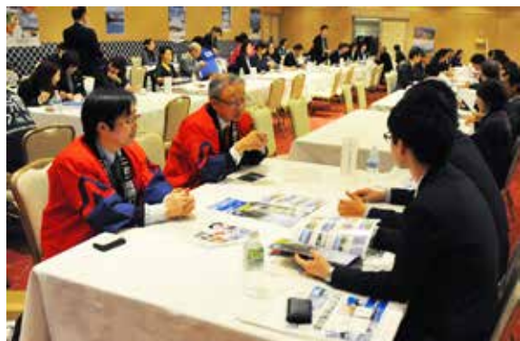
会津磐梯山エリアの魅力を説明する商談会

県外からの教育旅行誘致拡大を目的とした会津磐梯山エリア「エクスカーショーン」は2月13日から15日まで、猪苗代、磐梯、北塩原の3町村で実施されました。エクスカーショーンには首都圏や関西地方で教育旅行を取り扱う旅行会社の担当者ら約50人が参加。野口英世記念館やエリア内のスキー場などを視察した後、14日には北塩原村の裏磐梯ロイヤルホテルで商談会が行われ、地元関係者らが熱心に本エリアの魅力を説明しました。