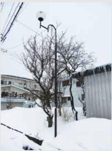
▲整備された防犯灯

このたび、一般財団法人自治総合センターの宝くじ社会貢献広報事業である、コミュニティ助成事業により、名古屋町区にLED防犯灯52基が整備されました。