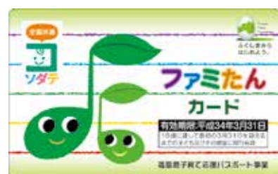
▲新しいファミたんカード

の強化事業で、福島県を含めた全国の41道府県が、昨年4月から「子育て支援パスポート事業の全国共通展開」に参加しています。町では、3月より全国の協賛店で利用できる新しいファミたんカードをこども園、保育所、学校などを通して配布する予定です。