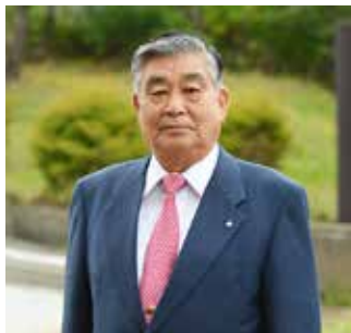
前後 公 猪苗代町長

が目標年次を迎えるため、平成29年4月から新しくスタートする『第七次猪苗代町振興計画』を策定いたしました。『第七次猪苗代町振興計画』では、『ともに地域を育て、みんなが心地よく暮らせるまち 猪苗代』を基本理念として、これから10年間のまちづくりを進めてまいります。