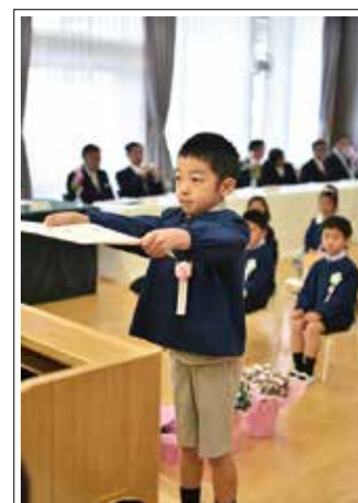
【撮影日】3月17日 【撮影場所】さくらこども園