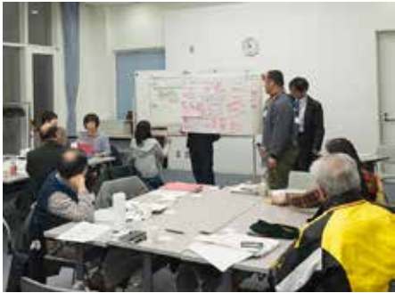
いなわしろみらい会議の様子

これらの取り組みにより、あらゆる年代・立場の人たちが、「猪苗代町に住んでみたい」「いつまでも住み続けたい」という希望を持ち、猪苗代町を訪れる人たちも充実して過ごせるようなまちを目指します。その中で、町民同士、町民と来訪者、生産者と消費者などのつながりを深め、人と人、人とまちへ広がる多様な関係性を築くことで、さらに地域の魅力を輝かせ、みんなが心地よく暮らせるまちをつくります。