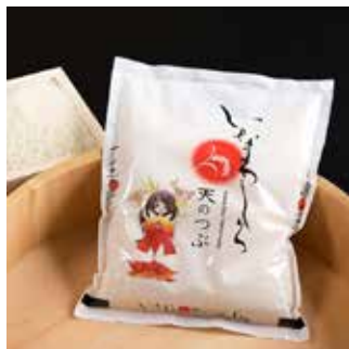
いなわしろ天のつぶ

○農産物に精通した人材を育成するとともに、ふるさと納税や食味向上など、「米（いなわしろ天のつぶ）」や「そば（いなわしろ天の香）」を始めとしたブランド化・競争力の強化を推進します。