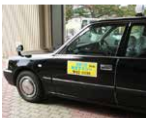
交通空白地域を解消するためのデマンド型乗り合いタクシー