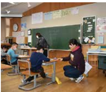
東京学芸大学との連携

○幼児教育から成人教育までの町ならではの一貫した教育モデルを構築するため、東京学芸大学と地域連携し、教育の充実および発展を推進します。